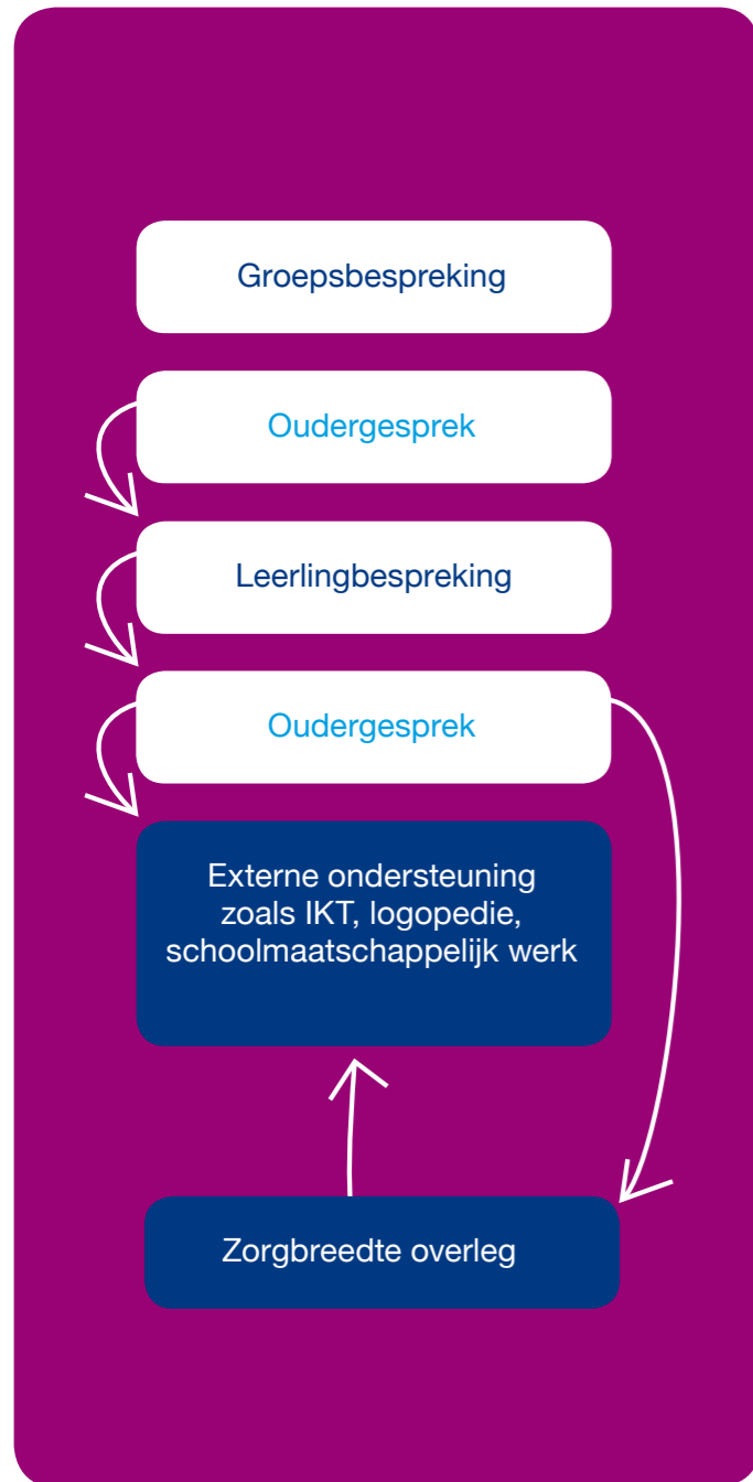
Onderwijs- en begeleidingsroute Willibrord

Van tevoren worden ouders op de hoogte gesteld als hun kind in de leerlingbespreking wordt besproken. Met ouders wordt dan onder andere de vraag besproken die in de leerlingbespreking gesteld wordt.