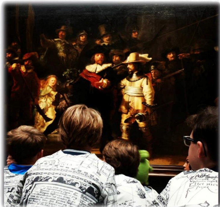
Bezoek Rijksmuseum- AMOSunIQ-

Op de website van de school en Op www.amosonderwijs.nl vindt u meer informatie over AMOS unIQ en over de toelatingsprocedure. Ook kunt u ons volgen op twitter via @AMOS_unIQ.