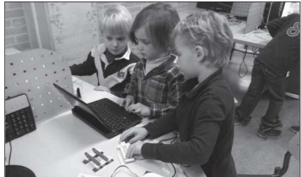
programmeerproject in groep 3

worden. De computer wordt ook tijdens de remedial teaching gebruikt om leerlingen extra te ondersteunen. Vanaf groep 5 gaan de leerlingen gericht werken met grafische en tekstverwerkende programma's om uiteindelijk een 'digitaal' werkstuk te maken. Hiertoe is op de eerste verdieping een mediatheek ingericht. Daar staat een netwerk van zestien computers, waaraan de leerlingen regelmatig kunnen werken.