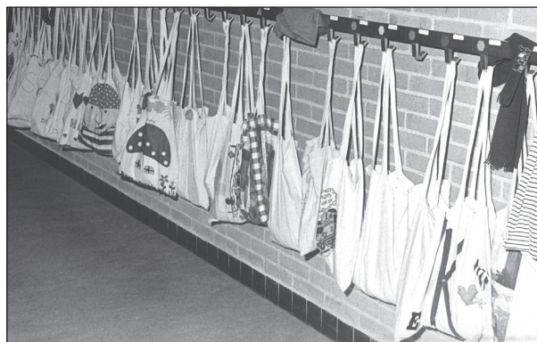
gang met gymtassen

De leerlingen krijgen vanaf groep 6 regelmatig huiswerk mee. Hiervoor moeten zij een huiswerkmap aanschaffen die in een schooltas past.