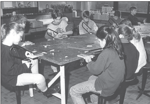
lokaal beeldende vorming

Het onderwijs is voornamelijk klassikaal georganiseerd; alle leerlingen in een groep krijgen gezamenlijk instructie: samen leren en elkaar stimuleren om mee te denken, te redeneren en van elkaar te leren. Binnen dit klassikale model wordt waar nodig gedifferentieerd in instructie en ver-