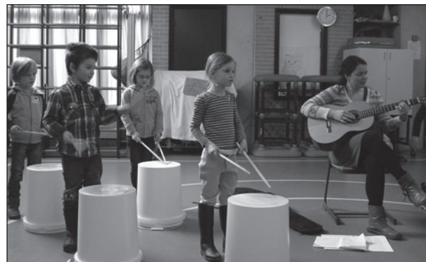
muziekles in groep 2

De lessen worden gegeven door een docent van de Amsterdamse Muziek-school en de groepsleerkracht.