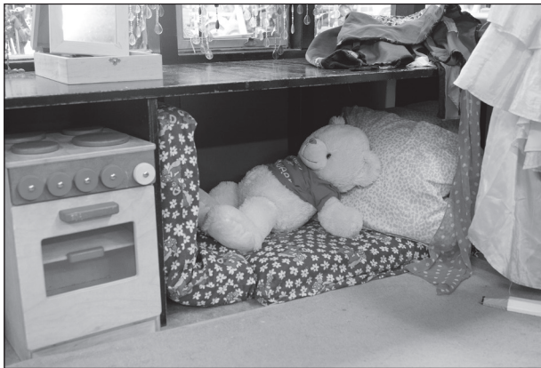
poppenhoek in groep 1, de berenklas*

Indien onvoldoende plaatsen beschikbaar zijn om alle aangemelde kinderen te kunnen plaatsen, zal (met inachtneming van de voorrangregels) worden geloot.