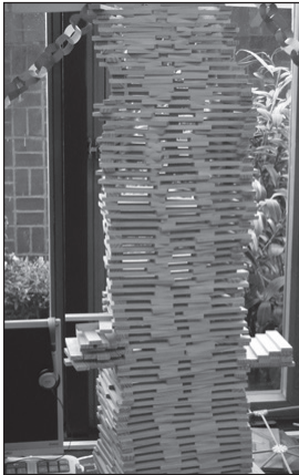
bouwen met kapla