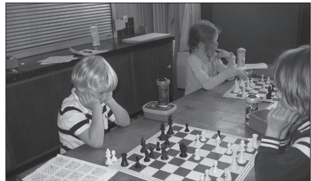
schaken tijdens het overblijven

Voor de goede orde melden wij u nog dat een leerling die niet overblijft en vóór 12.55 uur op het plein komt, zich ook aan de daar geldende overblijfregels moet houden.