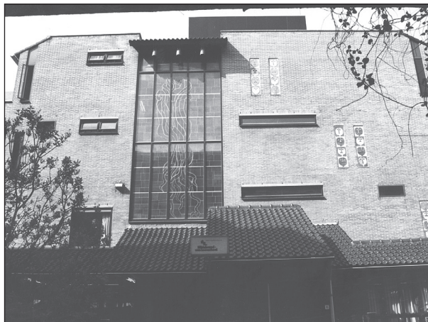
de voorgevel van de school

Onze identiteit wordt zichtbaar in de weekopeningen, de vertellingen van bijbelverhalen en vieringen. Maar niet alleen daar. Wij willen graag dat onze identiteit een plaats krijgt in de dagelijkse gang van zaken. Wij streven er in de lessen naar dat de leerlingen stilstaan bij de zin van het