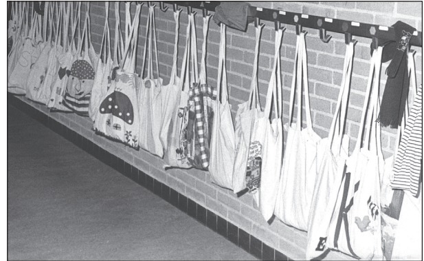
gang met gymtassen

De leerlingen krijgen vanaf groep 6 regelmatig huiswerk mee. Hiervoor moeten zij een huiswerkmap aanschaffen die in een schooltas past.