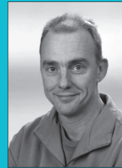
Edo Bootsma bewegingsonderwijs