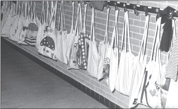
gang met gymtassen

De leerlingen krijgen vanaf groep 5 regelmatig huiswerk mee. Hiervoor moeten zij een huiswerkmap aanschaffen die in een schooltas past.