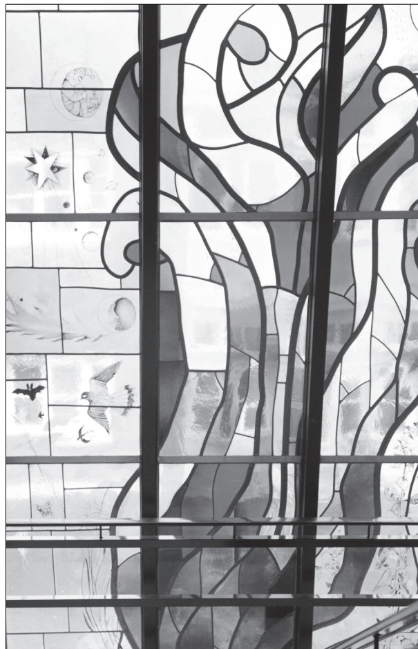
glas in lood-raam in trappenhuis