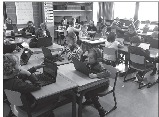
rekenen op de tablet i.p.v. in een schrift

In alle groepen zijn digitale schoolborden waarmee de leerkrachten de instructie beeldender en effectiever kunnen geven. Ook de leerlingen maken er gebruik van bij presentaties. In de hele school is wifi en er zijn computers, laptops en tablets waar leerlingen en leerkrachten gebruik van maken. Voor de leerlingen in groep 5 t/m 8 is voor ieder kind een tablet beschikbaar, voor de groepen 3 en