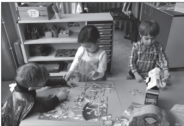
samen spelen en leren in groep 1

Het toewijzen van plaatsen gebeurt 6 à 10 maanden voordat het kind vier wordt. Hierbij gelden de