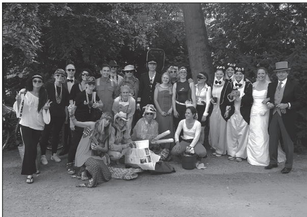
vossenjacht in het Vondelpark op de laatste schooldag

Lees daarom de Nieuwsbrief, help als uw hulp wordt gevraagd en geniet mee met uw kind.