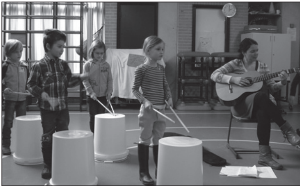
muziekles in groep 2

De lessen worden gegeven door een docent van de Amsterdamse Muziekschool en de groepsleerkracht.