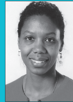
Janice Accord Impe Dimpe