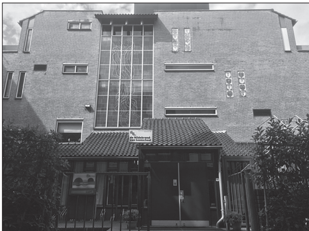
de voorgevel van de school

De “Christelijke Schoolvereniging voor Voorbereidend, Lager en Uitgebreid Lager Onderwijs, genaamd Van Loonschool” hield sinds begin 1900 de “Van Loonschool”, een interkerkelijke meisjesschool, in stand. De naam Van Loon was