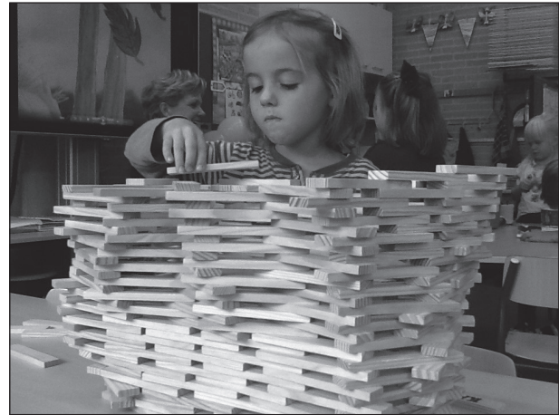
bouwen met Kapla

Leerlingen van de groepen 1a, 1 en 2 krijgen ontwikkelingsmateriaal aangereikt en/of brengen leer- materiaal mee van huis. Dat zijn vaak boeken en platen, maar ook materiaal in natura dat betrek- king heeft op het project dat op dat moment in de belangstelling staat. Hierover wordt gesproken en gezongen en hiermee wordt gespeeld, zodat de leerlingen steeds meer kunnen en gaan kennen over dat onderwerp