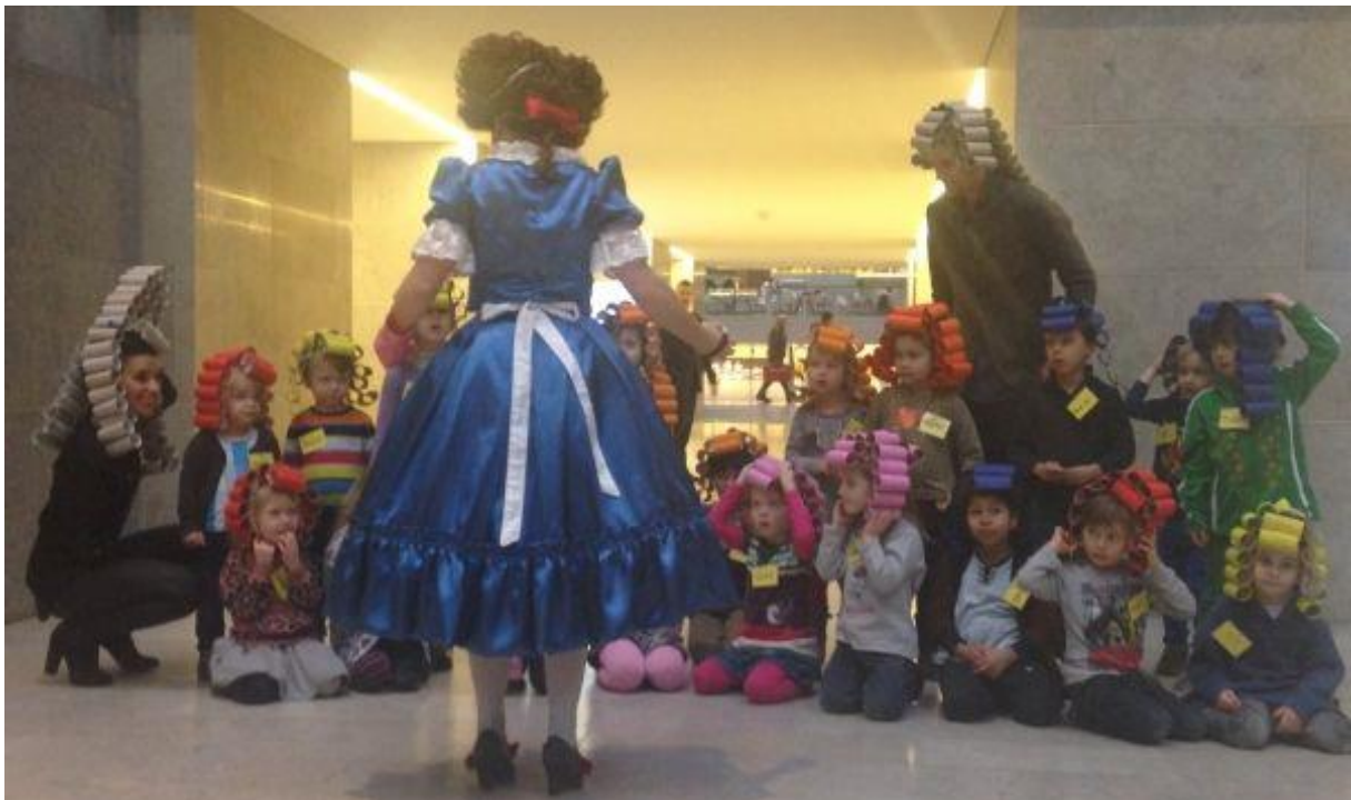
De kleuters bezochten tijdens het thema 'Kunst' het Rijksmuseum en maakten vooraf priuken van toilettrolletjes.

Aanvragen voor verlof moeten vier weken van te voren ingediend worden bij de directeur.