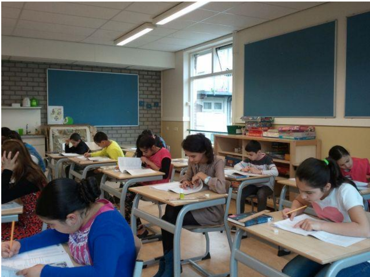
Kinderen van groep 7 buigen zich over de entree-toets.

Voor leerlingen met een beperking bestaat de mogelijkheid een aangepaste versie van de centrale eindtoets te maken. Het aanbod zal aansluiten bij het aanbod van de Eindtoets Basisonderwijs van Cito.