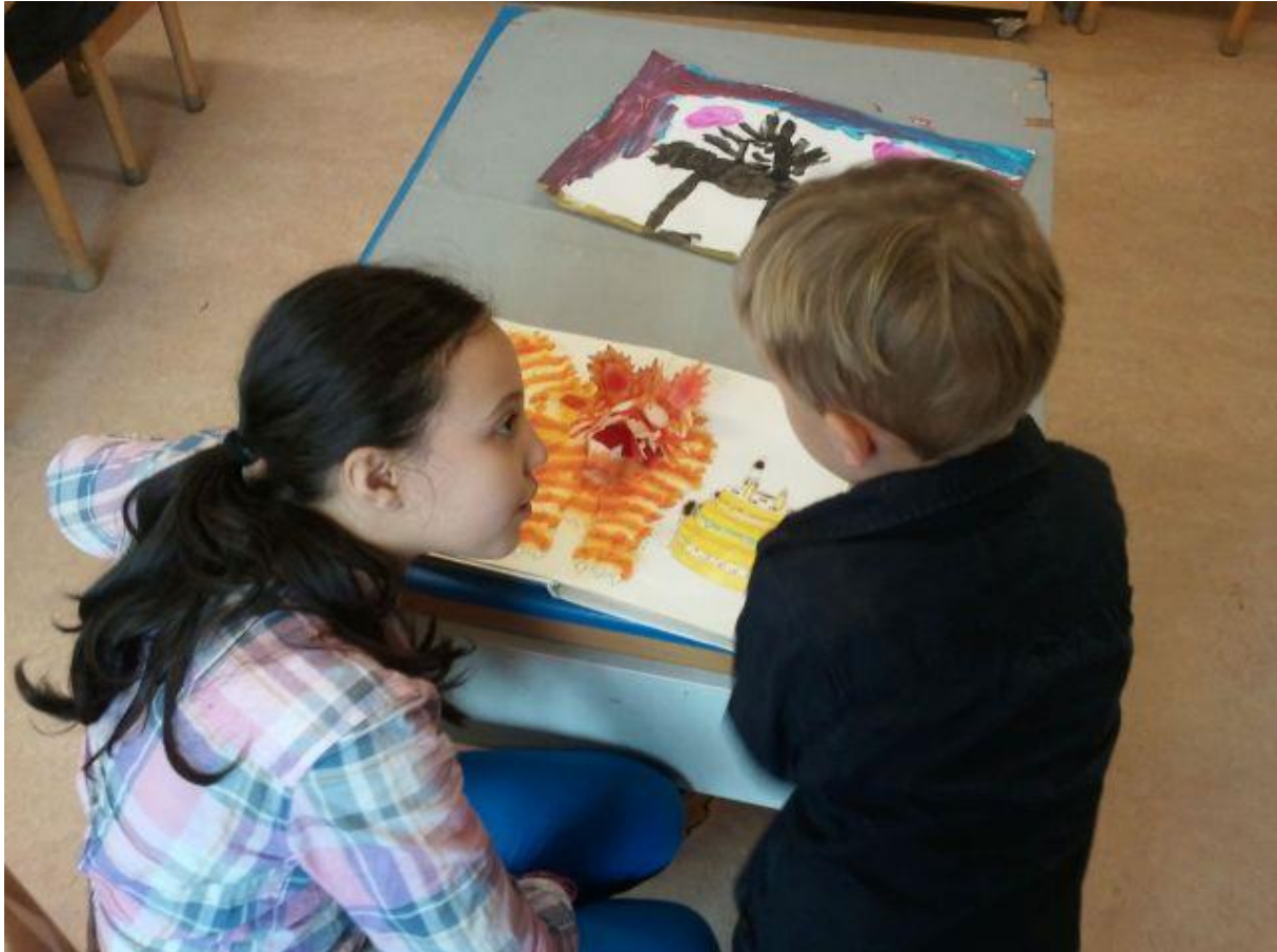
Voorleesweek: kinderen uit de bovenbouw lezen voor aan kleuters

Rosaboekdrukker kunnen terecht in het gebouw van kinderdagverblijf de Pionier tegenover de school, in de John Franklinstraat en in kindercentrum Mercator in de Vespuccistraat. De adresgegevens van Akros en van Partou zijn achterin de schoolgids opgenomen, evenals de gegevens van kinderopvang De Blauwe Duizendpoot. Amsterdam West Binnen de Ring heeft richtlijnen opgesteld voor de buiten schoolse opvang en voor de tussen schoolse opvang. Deze richtlijnen zijn op school in te zien.