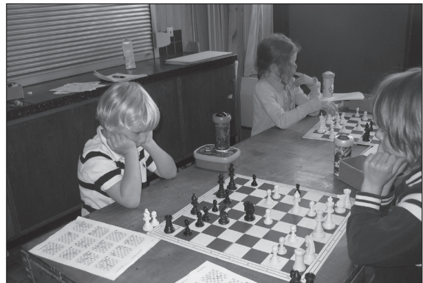
schaken tijdens het overblijven

Voor de goede orde melden wij u nog dat een leerling die niet overblijft en vóór 12.55 uur op het plein komt, zich ook aan de daar geldende overblijfregels moet houden.