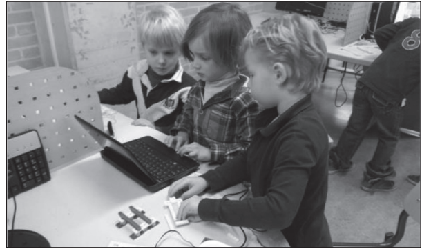
programmeerproject in groep 3