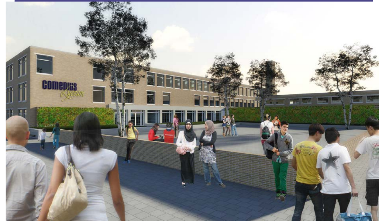
Het nieuwe gebouw is in de Jacob Geelstraat vlakbij station Lelylaan