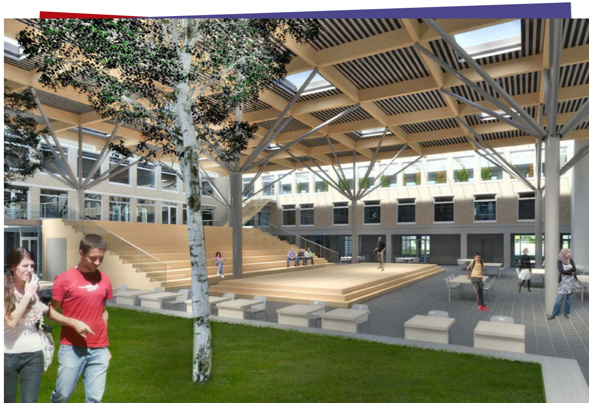
In ons nieuwe gebouw hebben we een grote aula

Het zijn deze woorden van Comenius die we als school benadrukken en proberen over te dragen aan onze leerlingen.