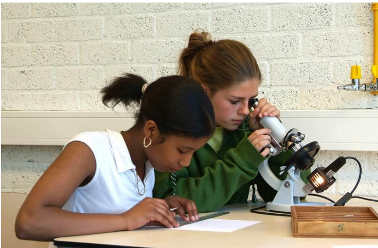
Een klimaat om in te leren

Op deze manier leren wij leerlingen - ook buiten de beeldende vakken om - op een creatieve manier na te denken. Deze onderzoekende houding maakt leren bovendien leuk: kinderen mogen binnen bepaalde grenzen op hun eigen manier vraagstukken oplossen en zich vrij ontwikkelen. Een leerling: 'Lessen hier zijn nooit saai, ze proberen hier op een andere manier iets uit te leggen.'