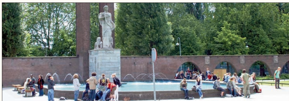
Het Indië-Nederland Monument tijdens de pauze.

Voor de maandag na de herfstvakantie, de kerstvakantie, de voorjaarsvakantie en de meivakantie wordt geen huiswerk opgegeven. Proefwerken worden door de docenten ten minste één week van te voren opgegeven. Ook de stof voor het proefwerk moet dan vaststaan.