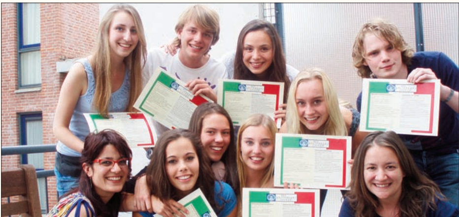
Corso leerlingen met hun diploma

In hun laatste jaar nemen leerlingen deel aan het examen voor het Certificazione di Italiano come Lingua Straniera (CILS). Zij kunnen hiermee gaan studeren aan instellingen voor hoger onderwijs in Italië. Voor het deelnemen aan Corso Italiano wordt jaarlijks een extra bijdrage gevraagd. (Zie " overige schoolkosten ").