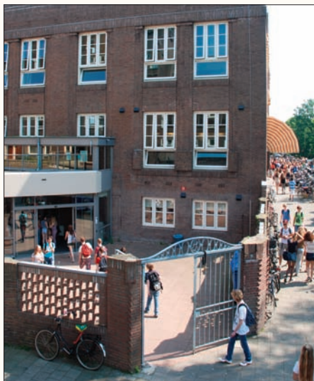
Ingang Gunningplein (westingang, zuidzijde).