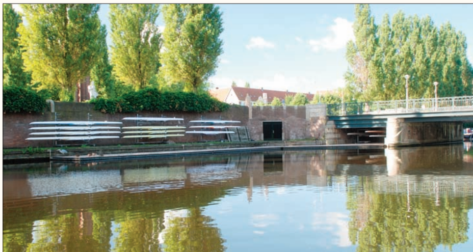
Roeivereniging De Drietand

De Drietand is de oudste club van de school, opgericht in 1930. Het is de enige schoolroeivereniging in Nederland, aangesloten bij de Koninklijke Nederlandse Roeibond. De roeiers hebben een eigen onderkomen, het botenhuis onder de Lyceumbrug. De Drietand is een zelfstandige vereniging die door de leden wordt bestuurd en waarvan de activiteiten door de leerlingen worden georganiseerd. Er is een uitgebreid trainingsschema verzorgd vanuit de KNRB. Tijdens de winterstop moet het materiaal onderhouden worden. Jaarlijks staat de Lyceumbekerwedstrijd voor docenten en leerlingen op het programma.