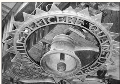
De klok voor de inauguratie van nieuwe leerlingen.

De verwachtingen die we van onze leerlingen hebben, zetten we om in duidelijke eisen aan hun leerprestaties en we gebruiken de evaluatie van die leerprestaties steeds als basis voor begeleiding en hulp bij het leerproces.