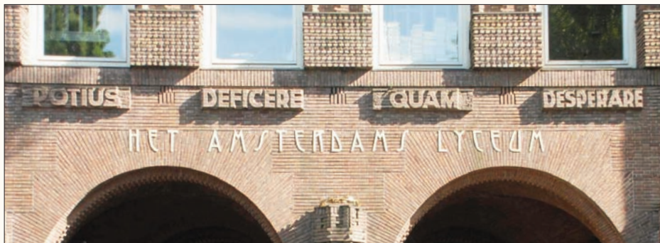
potius deficere quam desperare (noordzijde).