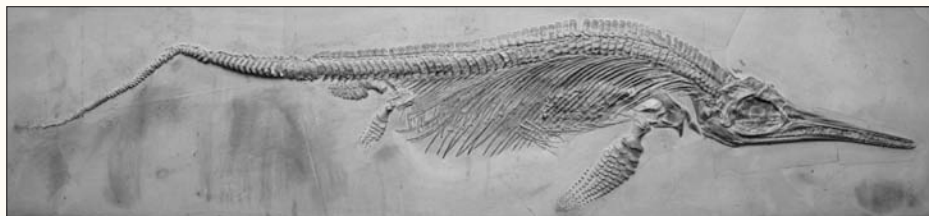
Ichthyosaurus Quadriscissus Qu.