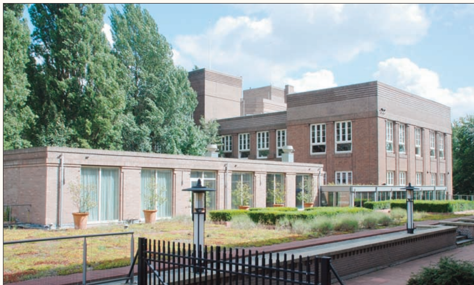
De daktuin voor de docentenkamer boven op de gymzalen.