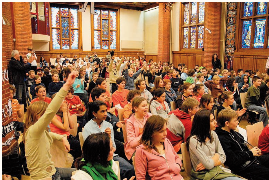
Aula ontworpen door Herman Baanders, verbouwd in 2001 door André van Stigt.

Naast Het Amsterdams Lyceum, inmiddels het oudste lyceum van Nederland, zijn op dit moment de deelnemende scholen: het Lorentz Casimir Lyceum (Eindhoven), Het Baarnsch Lyceum en het Kennemer Lyceum (Overveen).