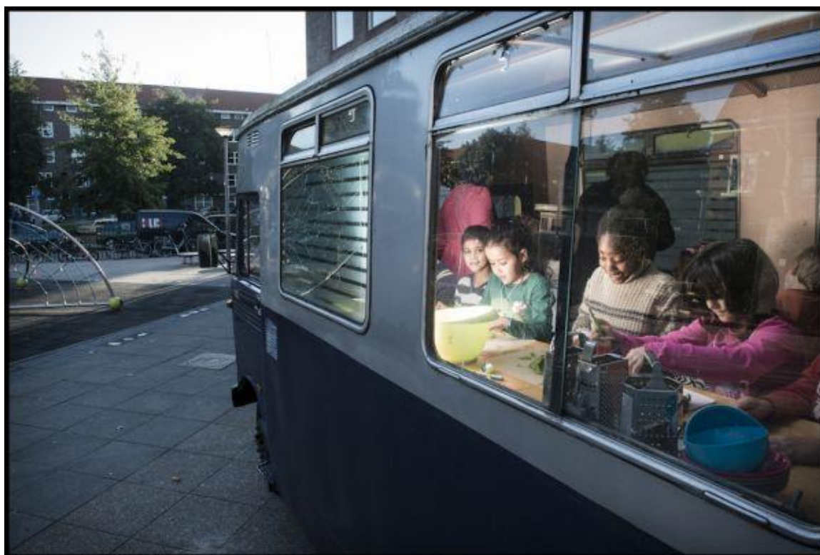
Tijdens het project Mercator en de Wereld, maakten de kinderen in de kookbus heerlijke hapjes.

De vakanties staan vast en de meeste vrije dagen en bijzondere activiteiten ook. Veranderingen krijgt u altijd bijtijds in het Boekdrukkertje te lezen.