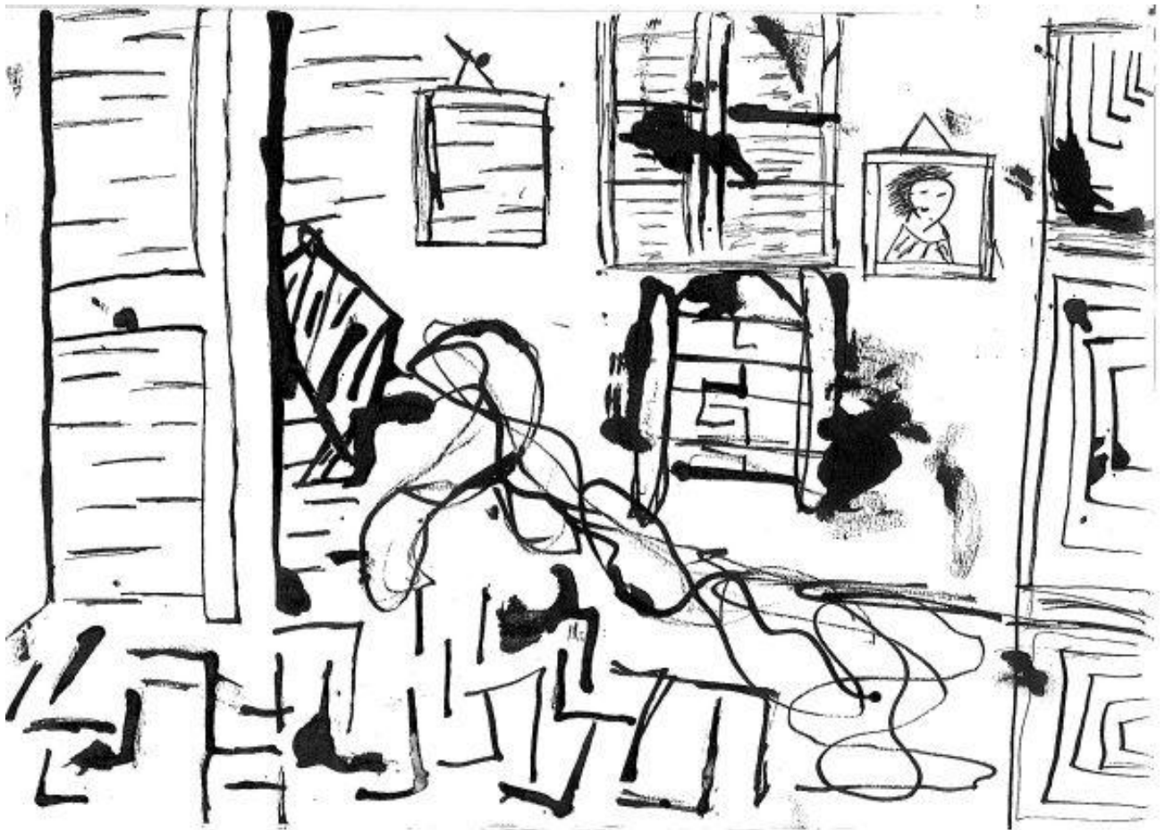
De kinderen van groep 7 bezochten in 2012 – 2013 verschillende musea. Het Van Gogh Museum hoorde daar ook bij. Hanan tekende met inkt de slaapkamer van Vincent van Gogh.

De onderwijsinspectie is er om de kwaliteit van het onderwijs te beoordelen en te bevorderen. Zij doet dit volgens de kaders van de 'Wet op het onderwijstoezicht'. De inspectie verricht verschillende soorten onderzoeken op basisscholen. De inspectie rapporteert haar bevindingen op de website www.kwaliteitskaart.nl