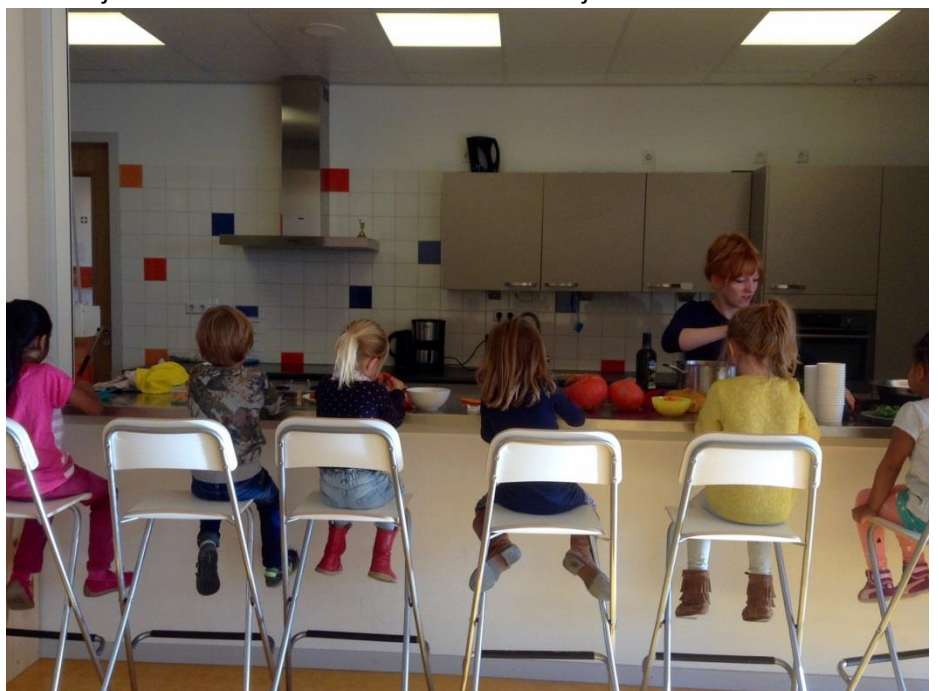
Samen pompensoep maken

Fruit4School plantte appel- en perenbomen in onze tuin en het NME geeft jaarlijks lessen over de groei van fruit. We hebben grote bakken waarin we groenten en kruiden kweken, en koken af en toe gerechtjes van onze oogst. Vorig schooljaar schaften we met geld van de Ouderraad