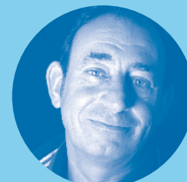
Ferry Kaljee Groep 8