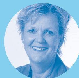
Alietini Wienke Groep 2