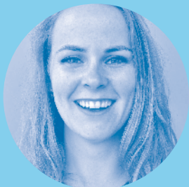
Esley Hogendoorn Groep 1A