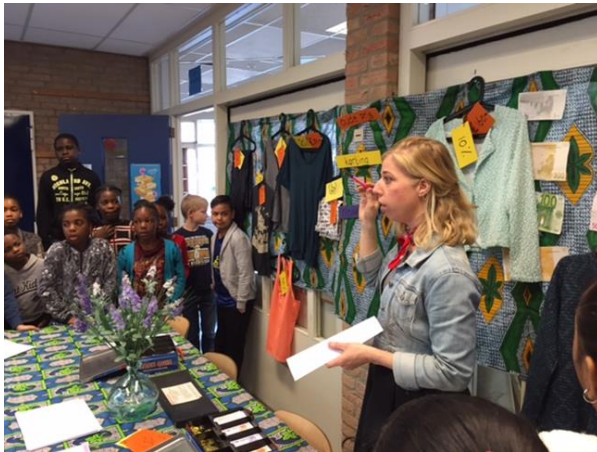
"Week van het geld"

In de groep 3-4 gebruiken we ook de rekenspelletjes 'Met sprongen vooruit'.