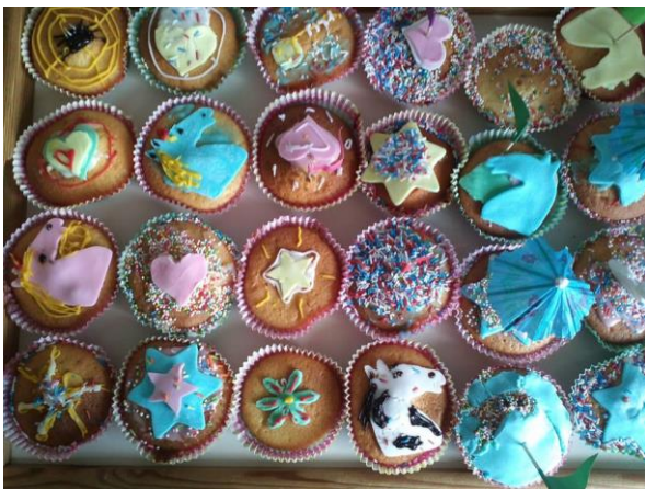
In juni 2015 namen kinderen en ouders het initiatief om cakejes te bakken en te verkopen. De opbrengst ging naar de Nepal-actie

We vinden het belangrijk dat de leerlingen leren om met elkaar samen te werken. Kinderen kunnen veel van elkaar leren en komen samen vaak tot betere oplossingen dan alleen. We laten kinderen geregeld dingen aan elkaar uit leggen. Ook geven we veel opdrachten waarbij de leerlingen samen een taak of een product moeten maken. Er wordt besproken hoe de samenwerking verloopt en hoe het misschien nog beter kan.