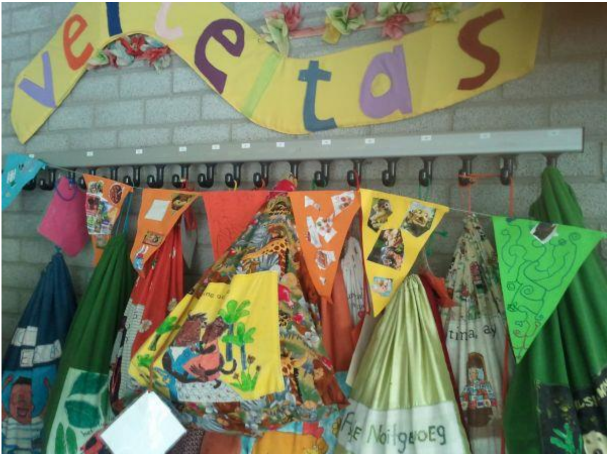
De Rosa Boekdrukker bezit een groot aantal verteltassen die door ouders gemaakt werden en worden onderhouden. De verteltassen kunnen geleend worden.

Vanaf de start op school wordt veel aandacht besteed aan de taalontwikkeling. Dat begint met de mondelinge taal: luisteren naar verhalen en ideeën van anderen en het duidelijk onder woorden leren brengen van je eigen gedachten. Het uitbreiden van de woordenschat is daarbij van groot belang. Dat wordt onder andere gedaan volgens de aanpak 'Met Woorden in de Weer'. Vanaf groep 4 wordt de nieuwste versie van de methode 'Taal Actief' gebruikt. Naast spreken, luisteren en woordenschat komen daarin ook de vaardigheden spelling en schrijven van teksten aan bod. De methode biedt ruimte om de lesinhoud af te stemmen op het niveau van de leerlingen.