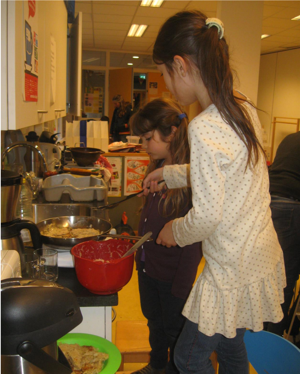
In 2014 – 2015 konden kinderen meedoen met de na schoolse activiteit koken

Voor klachten over seksuele intimidatie bestaat een wettelijke meldplicht door het bevoegd gezag bij de vertrouwensinspecteur van de Inspectie van Onderwijs. Naast de bestaande aandachtsgebieden kunnen betrokkenen uit het onderwijs bij dit meldpunt ook terecht met signalen betreffende discriminatie, fundamentalisme, extremisme en dergelijke.