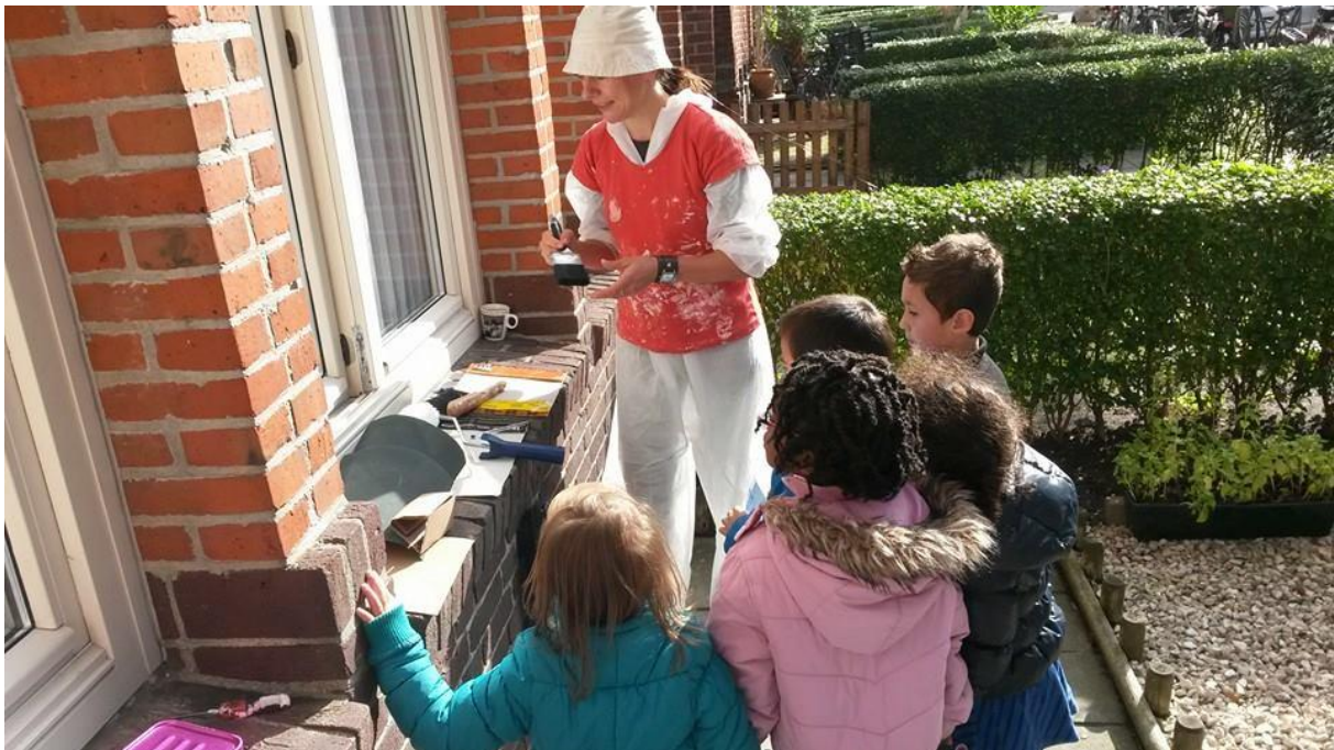
In oktober 2014 gingen de kleuters in de buurt op zoek naar ouders die een beroep uitbeeldden