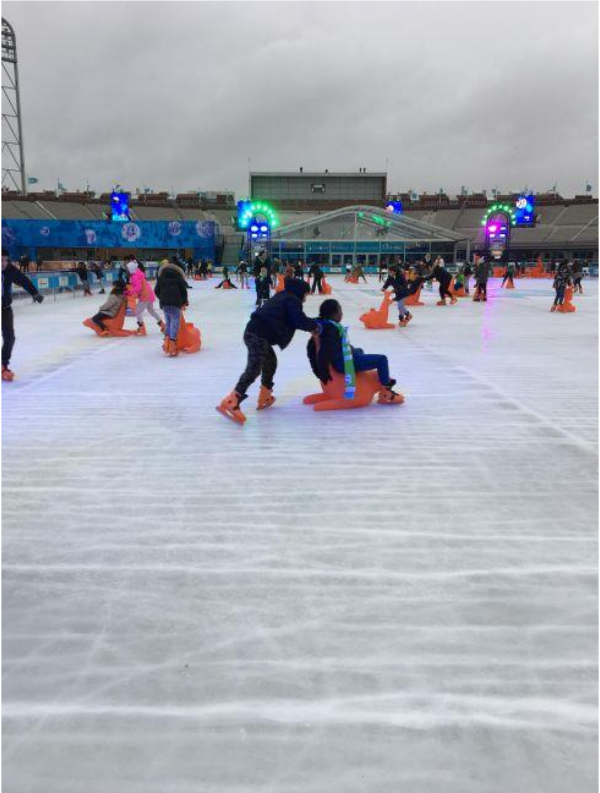
In februari 2018 schaatsten we met de bovenbouw op de Coolste baan van Nederland. Ondanks het regenachtige weer genoten de kinderen met volle teugen.