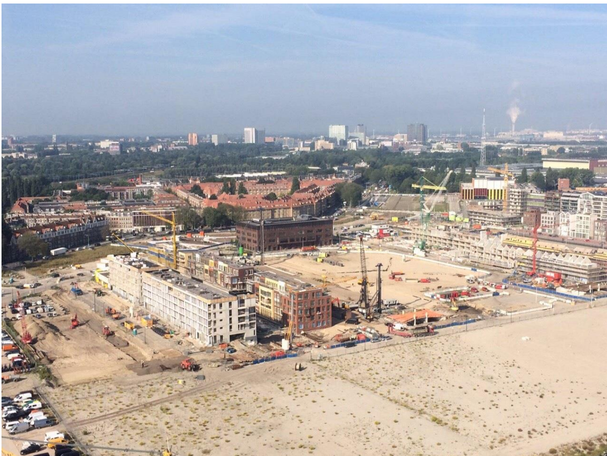
Maandag 28 augustus 2017: de Houthaven vanaf de pontsteiger, met in het midden het gebouw waarin de Spaarndammerhout gevestigd is.

De populatie van De Spaarndammerhout is kleurrijk en een afspiegeling van de populatie van de buurt.