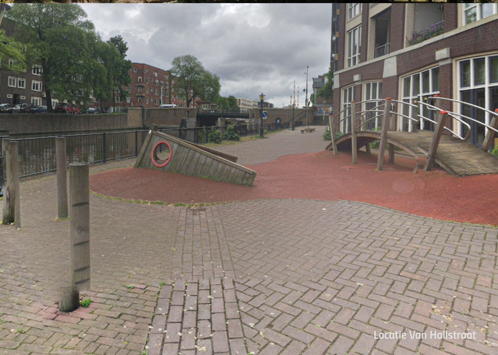
Locatie Van Hallstraat