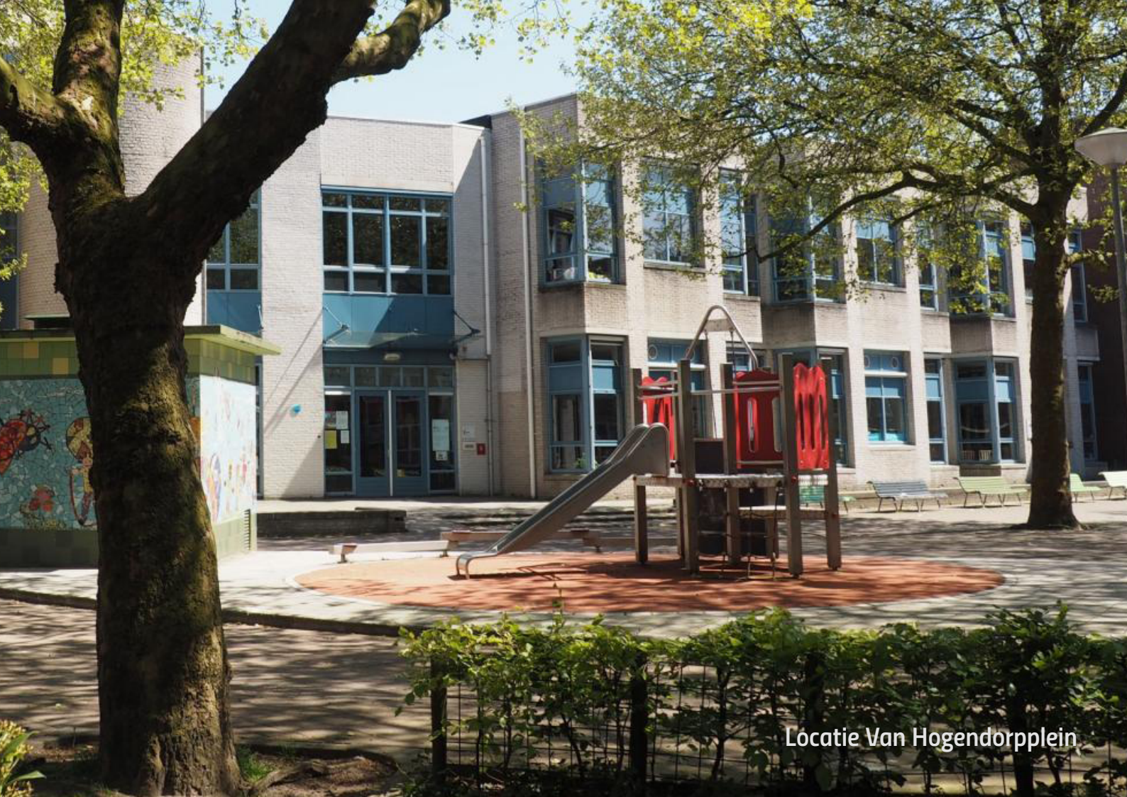
Locatie Van Hogendorpplein