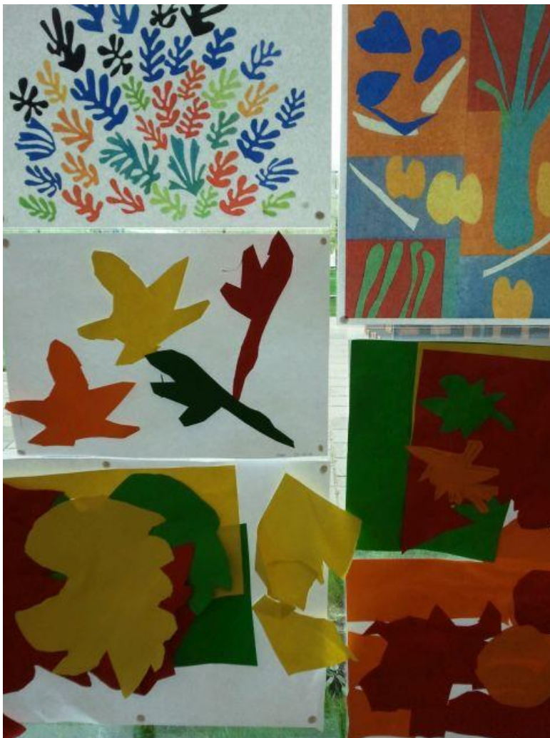
Knipkunst van de kleuters

Op het gebied van kunst, cultuur, sport, dans, muziek en creativiteit kon het brede aanbod van activiteiten voor de kinderen in het schoolse en naschoolse programma gehandhaafd blijven en worden uitgebreid. Ook in 2015 – 2016 zal dat het geval zijn.