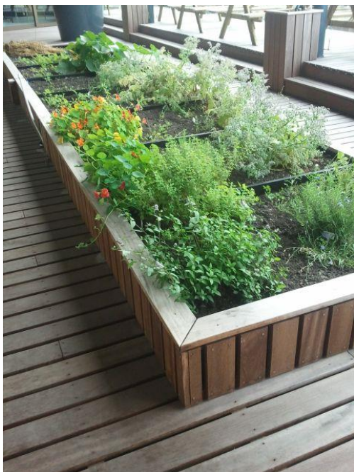
In de plantenbakken op het balkon werd door ouders en kinderen een moestuin aangelegd. De bloemen trekken hommels en vlinders aan.

-studenten van het ROC die een opleiding tot klassen assistent of een administratieve opleiding volgen.