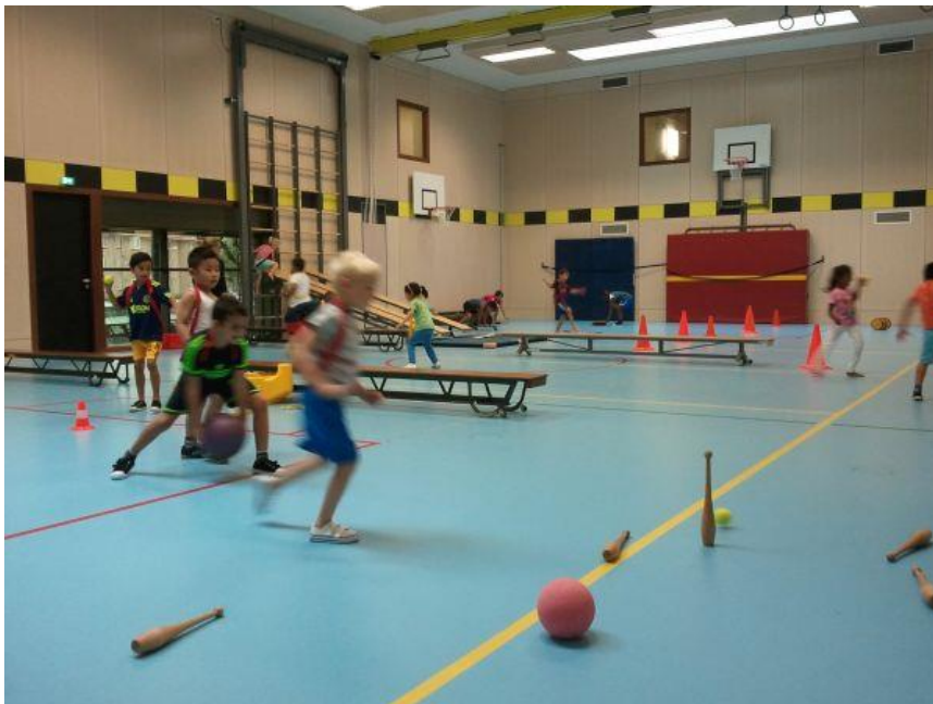
Elke groep krijgt twee keer per week bewegingsonderwijs van de vakleerkracht

Voor leerlingen met een beperking bestaat de mogelijkheid een aangepaste versie van de centrale eindtoets te maken. Het aanbod zal aansluiten bij het aanbod van de Eindtoets Basisonderwijs van Cito.