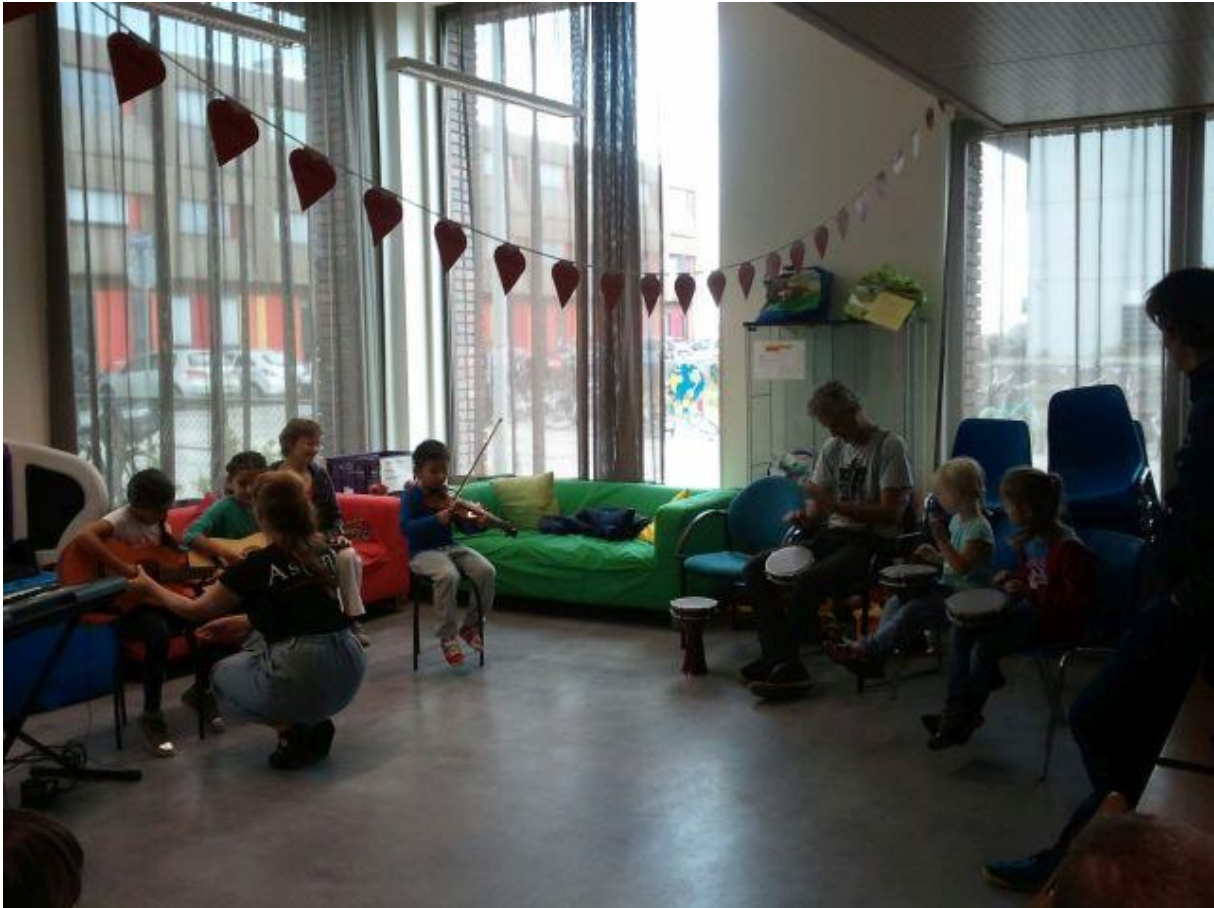
De open les in augustus 2015, verzorgd door muzikanten van Aslan Muziekcentrum

Voor onze muzieklessen werken we samen met Muziekcentrum Aslan. Alle groepen van de school krijgen één keer per week muziekles van de muziekdocent van Aslan. Daarin wordt veel gezongen, worden instrumenten bespeeld en komen de kinderen in aanraking met zaken als melodie, ritme en noten lezen. De muzieklerkracht begeleidt daarnaast de talentband, voor leerlingen uit de bovenbouw.