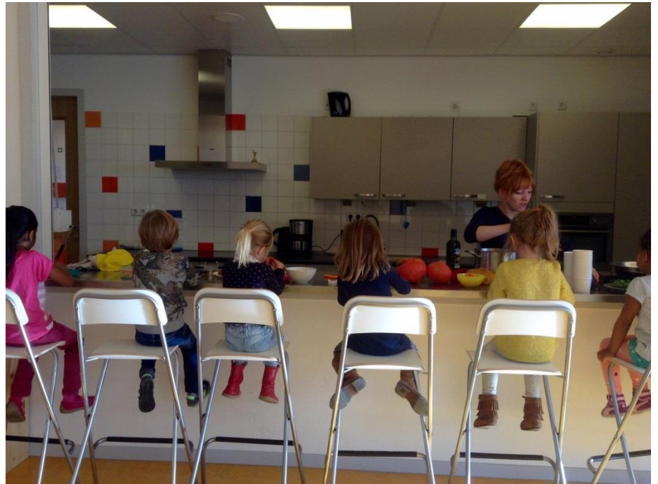
Samen pompoensoep maken

Schoolbreed is er veel aandacht voor natuur. Fruit4School plantte appel- en perenbomen in onze tuin en geven lessen over de groei van fruit, we schaften bakken aan voor het kweken van groenten en kruiden, en koken af en toe gerechtjes van onze oogst. Ook dan leggen we graag bredere verbanden: een lesje spelling na de oogst, een lesje rekenen voordat er wordt gekookt. Natuur en techniek bouwen we dit jaar nog wat meer uit door de kinderboekenweek, met als thema wetenschap en techniek, te gebruiken om materialen in te zamelen onder