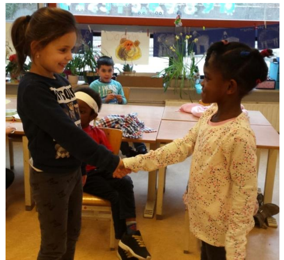
Zo geven wij elkaar een hand.