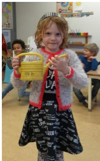
Zo draag ik een gieter.