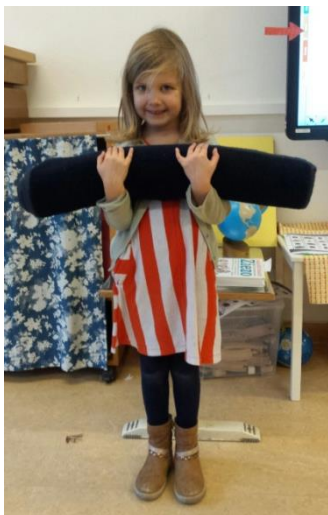
Zo draag ik een kleedje

De vaardigheden worden op speelse wijze aangeleerd in zogenaamde 'drie periodenlesjes': de leerkracht vertelt waar het lesje over gaat, de leerkracht doet het duidelijk voor en daarna mogen twee of drie kinderen dit nadoen. Tot slot benoemt de leerkracht wat zij en de kinderen geleerd hebben. De lesjes bevorderen de zelfredzaamheid van de kinderen.