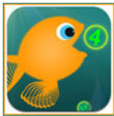
Hongerige vis: Een rekenapp waarmee je leert optellen en aftrekken