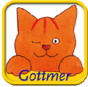
Dikkie Dik: digitaal en interactief