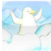
Bino: zoek de pinguin