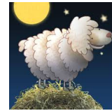
Slaap lekker: Wens de dieren welterusten