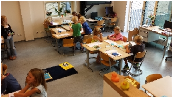
in de klas

De lokalen zijn zo ingericht, dat de kinderen alles wat zij voor hun ontwikkeling nodig hebben, zelf kunnen pakken. Montessori spreekt van de voorbereide omgeving. De door Montessori ontwikkelde materialen in de klas passen precies bij de ontwikkelingsbehoeften van de desbetreffende leeftijdsgroep.