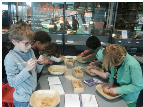
museumles in Naturalis

De sportdag vond vorig jaar plaats in het Olympisch Stadion. Het was een heel groot succes en ook dit schooljaar zal een sportdag in het stadion worden georganiseerd.