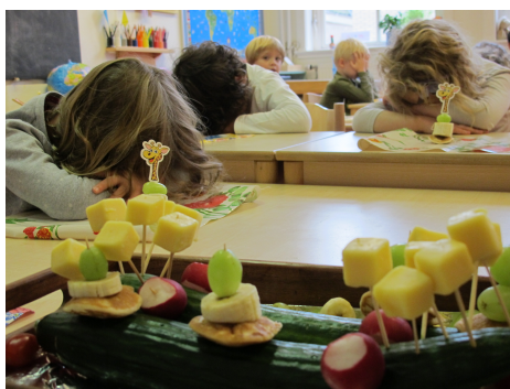
een gezonde én mooie traktatie