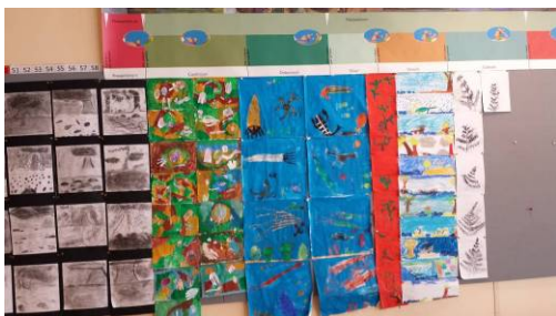
tijdlijn "ontstaan van het leven"

In de middenbouw volgen we een driejaarscyclus, waarin achtereenvolgens 'het ontstaan van het heelal' (sterren- en zonnestelsel), 'het ontstaan van de aarde' (geologie) en het 'ontstaan van het leven op aarde' wordt aangeboden. Alle middenbouwleerkrachten hebben daarnaast lessen gemaakt die betrekking hebben op door hen gezamenlijk gekozen thema's. Naast de drie grote thema's is er natuurlijk ruimte voor onderwerpen die samenhangen met actuele gebeurtenissen of wisseling van de jaargetijden.