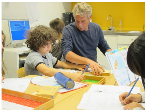
lesje in de rondgang