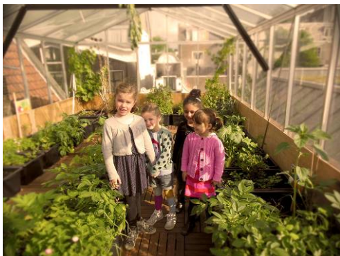
tuinen onderbouw in de kas

Na de zomervakantie wordt er vooral geoogst en worden de tuinen klaargemaakt voor de volgende groepen 6. Dat betekent dat er na de overgang naar groep 7 nog doorgegaan wordt tot het eind van het seizoen en dat is eind oktober.