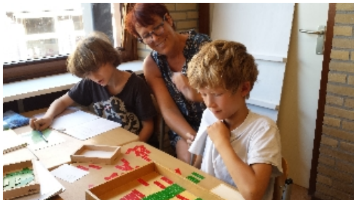
individuele aandacht in de rondgang

Het rekenonderwijs wordt gegeven met het montessorimateriaal en in groep 5 tot en met 8, met de methode "Alles Telt". Vorig schooljaar werken de kinderen en leraren met de nieuwe versie van deze methode. Voor het taalonderwijs gebruiken wij het Montessori materiaal met ondersteuning van aanvullende methoden (Nieuwsbegrip XL, een nieuwe leeslijn met verschillende leesmaterialen, de spellingslijn 'Op zoek naar letters' van Dolf Janson)