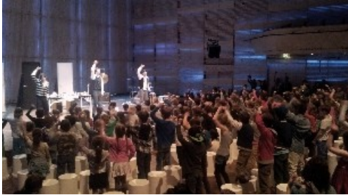
optreden in het Muziekgebouw

De school maakt gebruik van instellingen die zich met kunstzinnige vorming bezig houden, zoals de muziekschool Amsterdam en de educatieve afdelingen van musea. Er wordt naar gestreefd de kinderen een gevarieerd aanbod te presenteren. Onze cultuurcoördinatoren hebben in samenwerking met het team een meerjarenplan opgesteld.