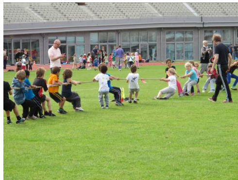
de Olympische sportdag in het stadion