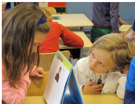
de heterogene groep, ouder kind helpt een jonger kind