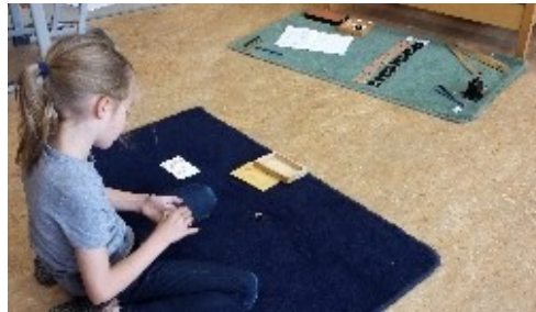
werken op een kledje