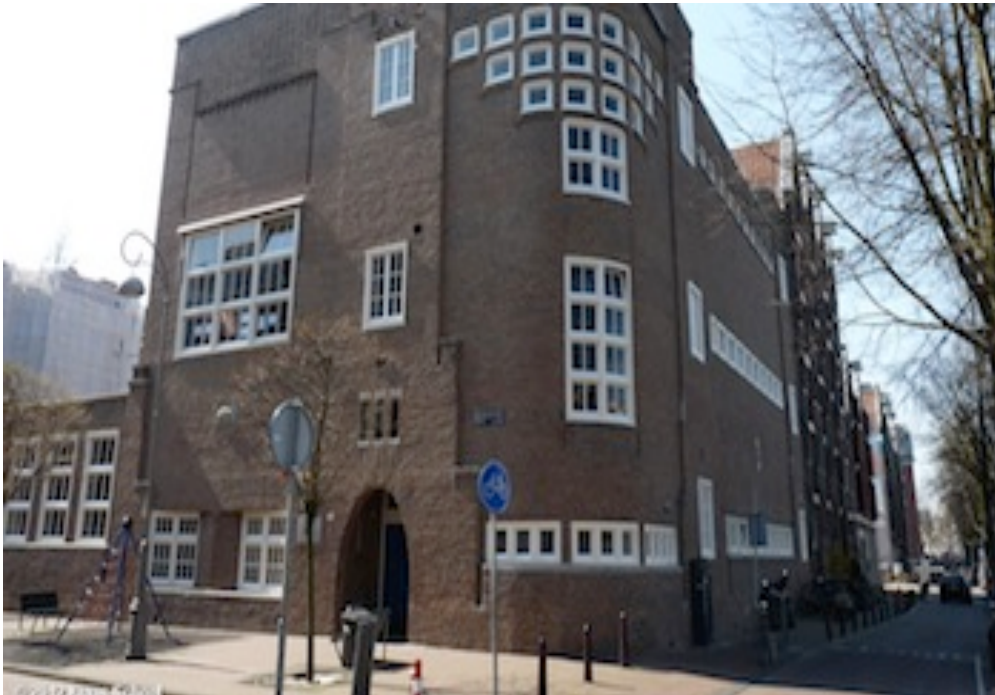
Stichting Openbaar Onderwijs aan de Amstel