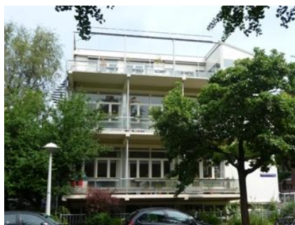
Onderbouw dependance Alb.Dürerstraat 36