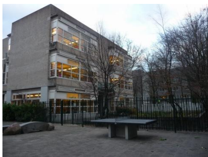
Hoofdgebouw Willem Witsenstraat 14