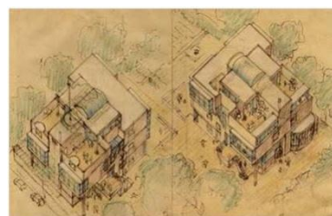
Montessori School Amsterdam, the Netherlands 1985

Contact met het bestuur: bestuur@de-ams.nl