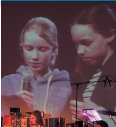
Gedichten voordragen in de bibliotheek van Amsterdam.