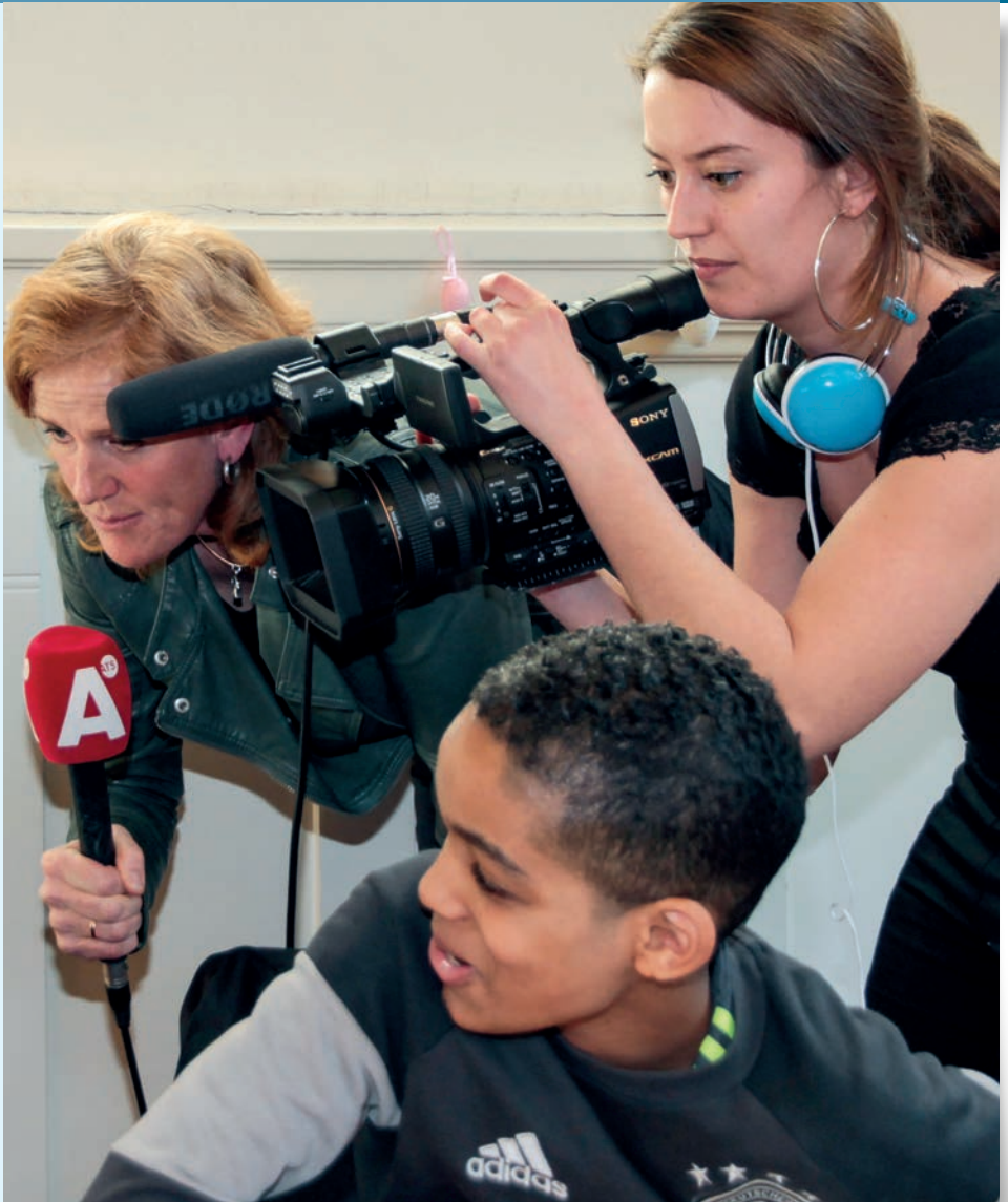
Het Sweelinck wint voor de 2e keer de leerlichtprijs!