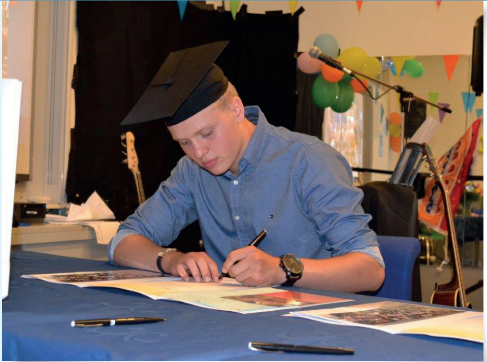
Ondertekenen diploma op het Sweelinck.

sen voor PTA II en PTA III kunnen herkanst worden in de herkansingweek. Gymnastiek moet voldoende worden afgesloten in de vierde klas. LOB moet aan het einde van het jaar met een voldoende worden afgesloten.