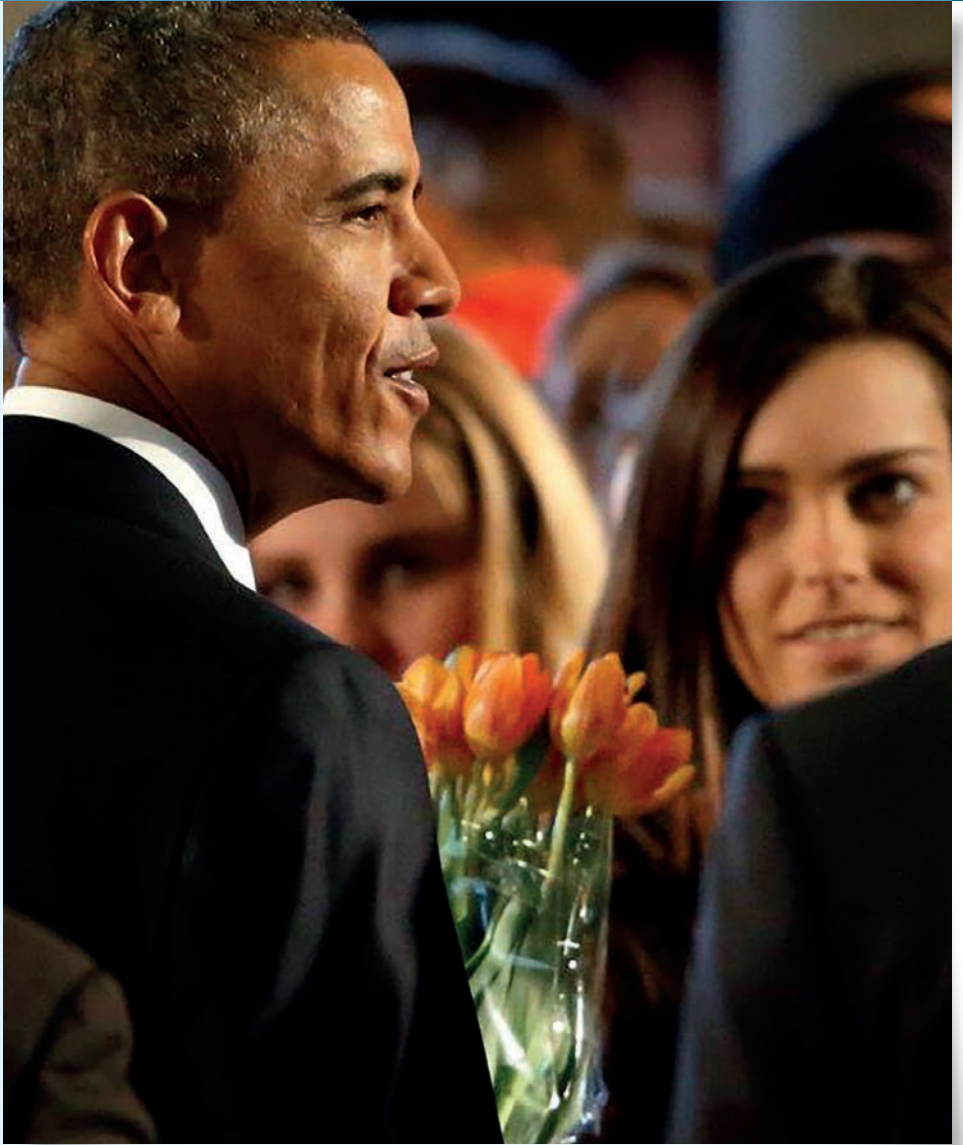
Het Sweelinck College ontmoet de oud- president van de Verenigde Staten.