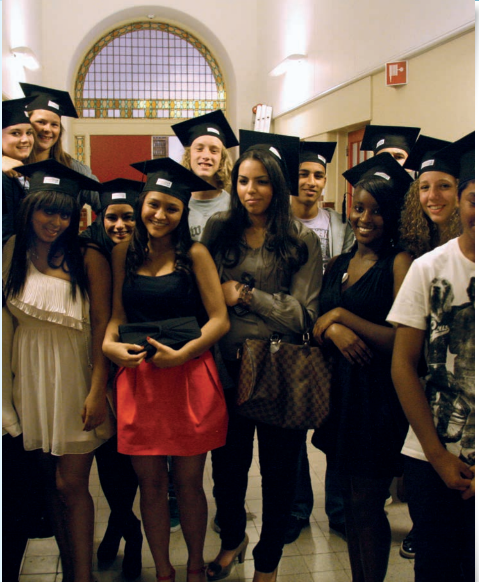
Op alle fronten geslaagd!