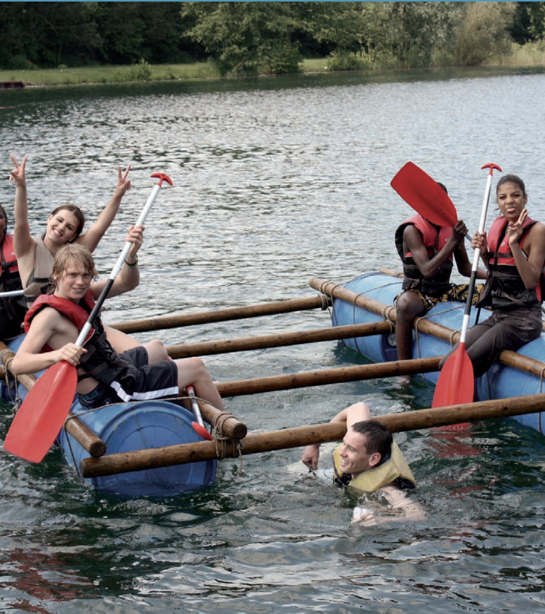
Op schoolreis leer je samen vlotten bouwen.