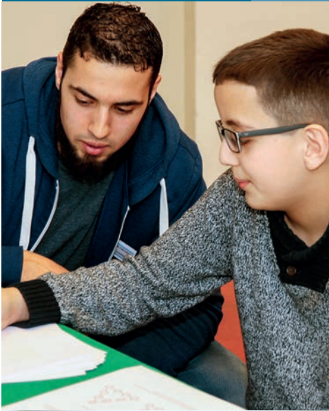
Individuele aandacht bij het vak economie.