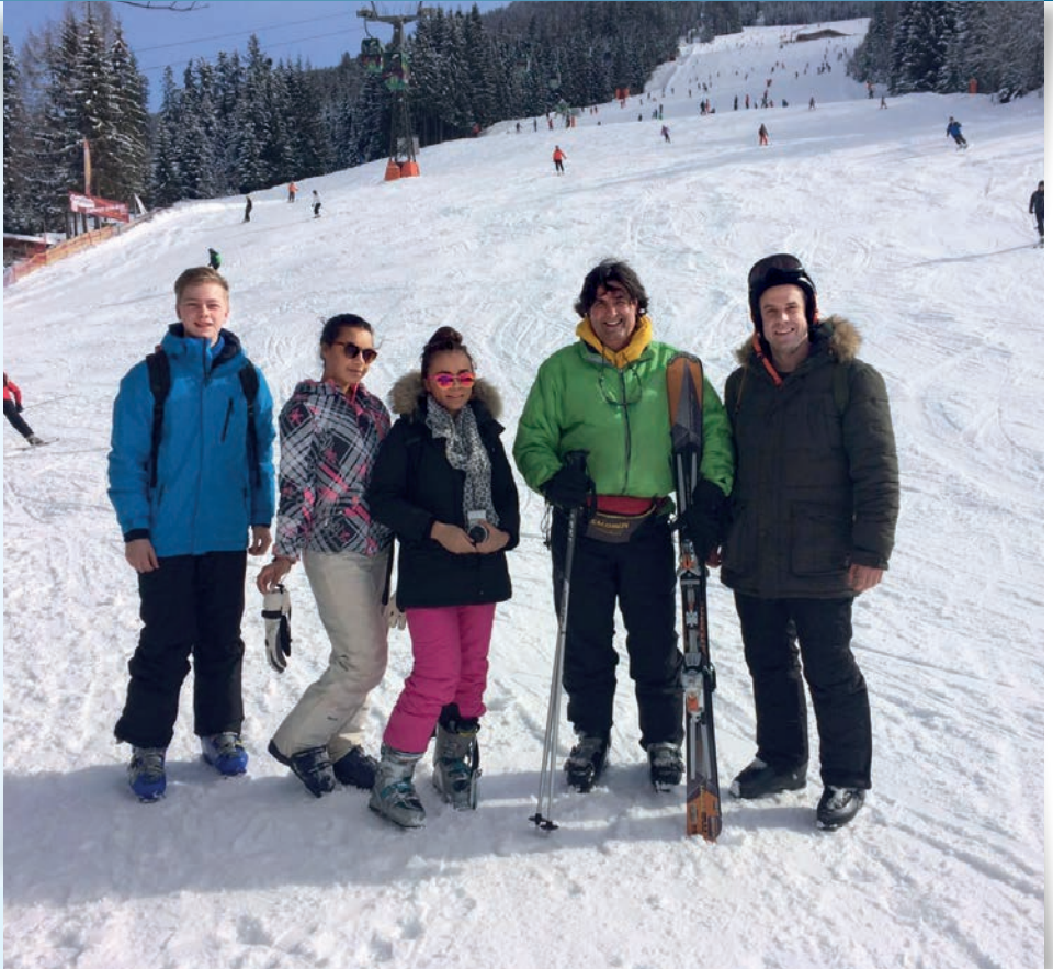
De 4de klas op wintersport.