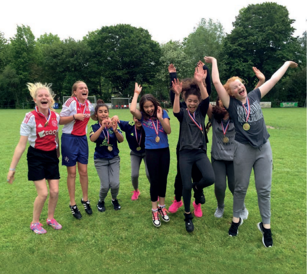
Sportdag gewonnen op het Sweelinck!