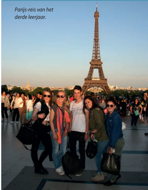
Parijs-reis van het derde leerjaar.

examenonderdeel (bijvoorbeeld het zonder geldige reden afwezig zijn bij een toets van het schoolexamen), kan de directeur maatregelen treffen. In het Eindexamenbesluit (een wettelijke regeling) staat dat de directeur van de school dan bijvoorbeeld het cijfer 1 kan toekennen of deelname aan een toets kan ontzeggen.