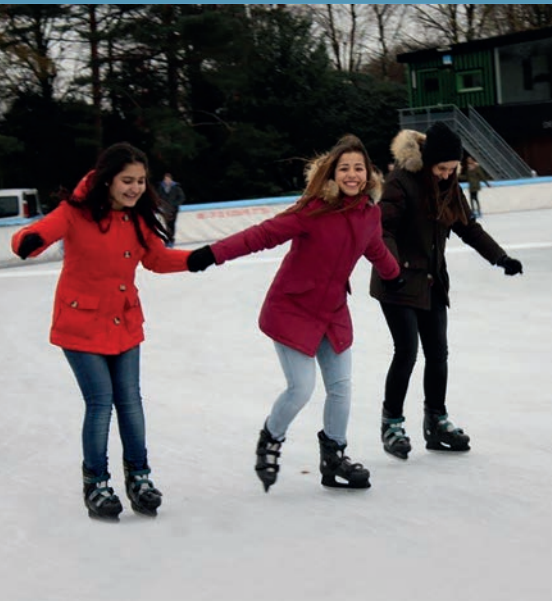
Het jaarlijkse schaatsuitje met alle leerlingen

LET OP: de school neemt geen enkele verantwoordelijkheid voor beschadigingen en/of diefstal van voornoemde apparaten.