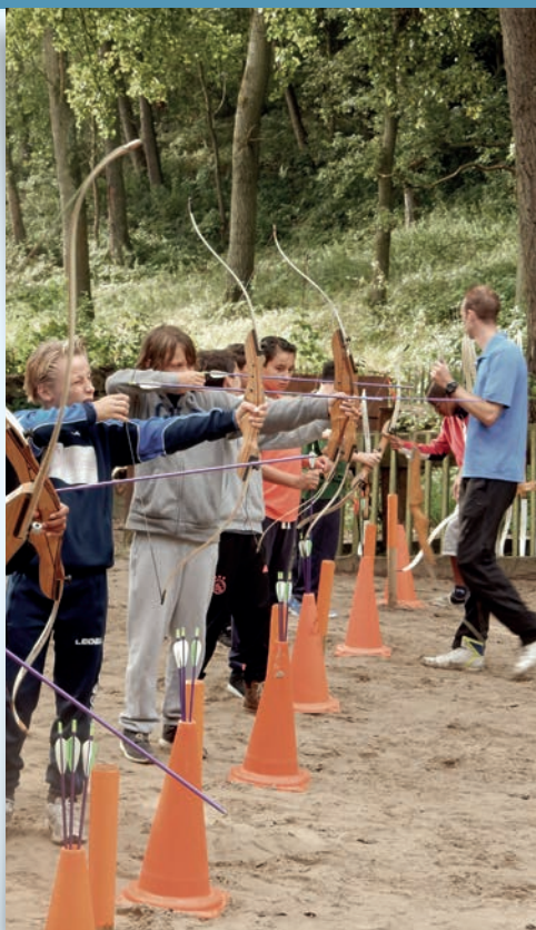
Spannend, leren boogschieten op kamp!

Is uw kind op school op een erg onaangename manier lastiggevallen? Misschien kunt u dan de hulp gebruiken van een vertrouwensinspecteur. Bij de onderwijsinspectie werken vertrouwensinspecteurs bij wie u terecht kunt voor het melden van klachten over gebeurtenissen in het onderwijs op het gebied van: