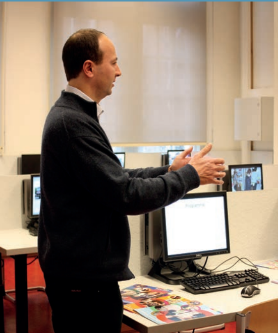
Docent wiskunde geeft extra uitleg.