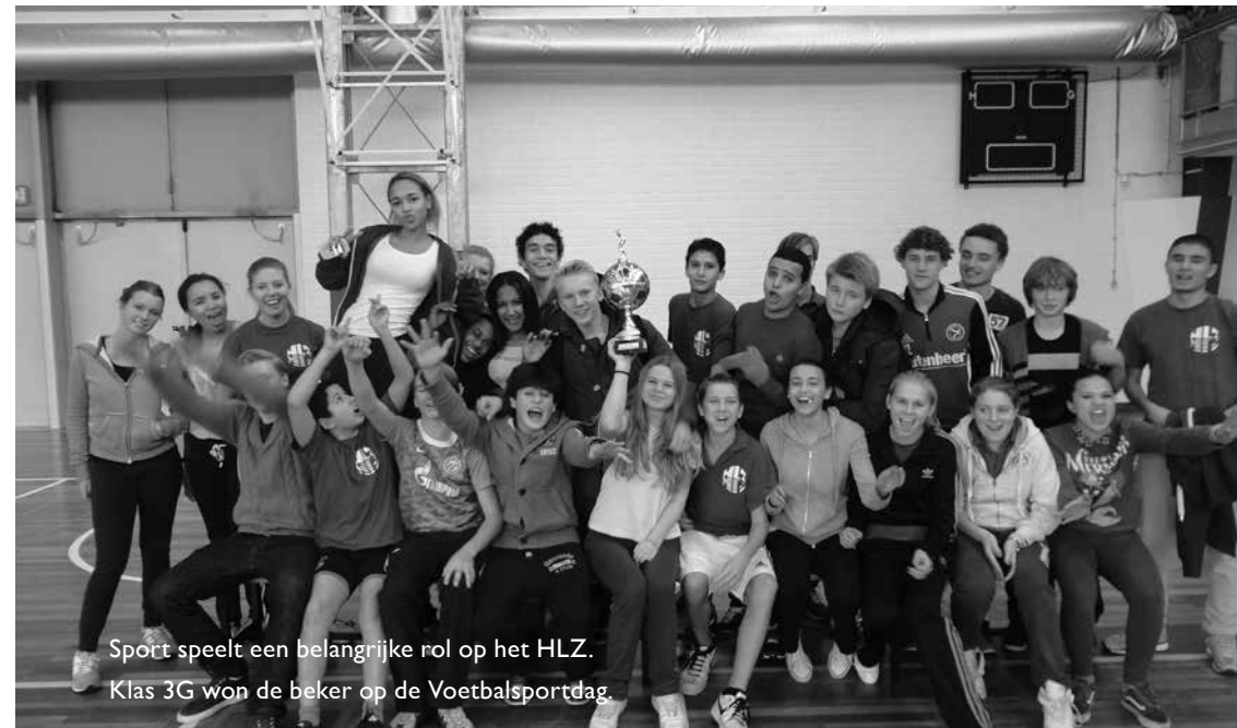
Sport speelt een belangrijke rol op het HLZ. Klas 3G won de beker op de Voetbalsportdag.

Alle sociale activiteiten worden toegevoegd aan het Sociaal Portfolio. Elke leerling van het HLZ vult gedurende zijn schoolloopbaan vanaf het eerste leerjaar dit Sociaal Portfolio.