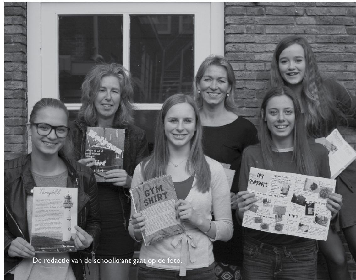
De redactie van de schoolkrant gaat op de foto.

Voor inlichtingen: Schoolboekhuis Iddink tel. 0900-4442222 (10 cent p/min.).