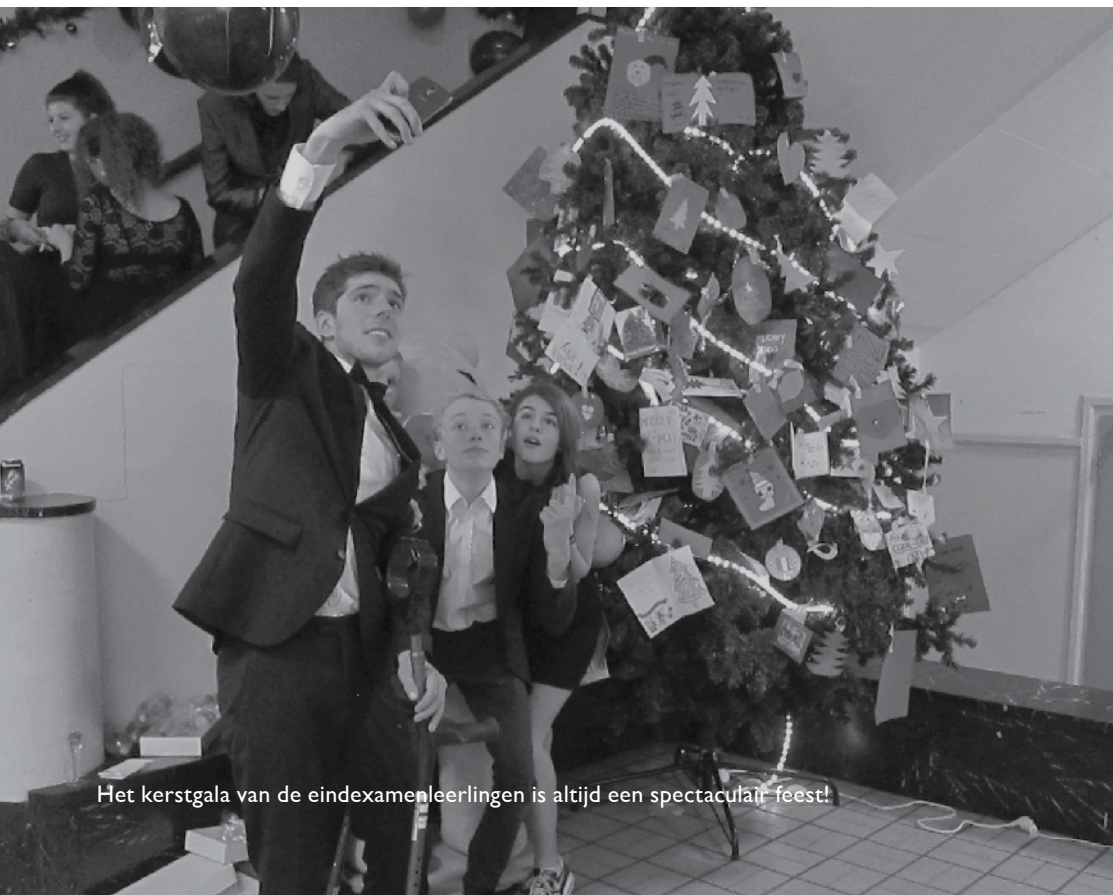
Het kerstgala van de eindexamenleerlingen is altijd een spectaculair feest!

Het aanvragen kan op de DUO site ( www.duo.nl , particulieren, Scholier, Tegemoetkoming Scholieren, aanvragen), liefst 3 maanden voor aanvang van het schooljaar (of 18e verjaardag).