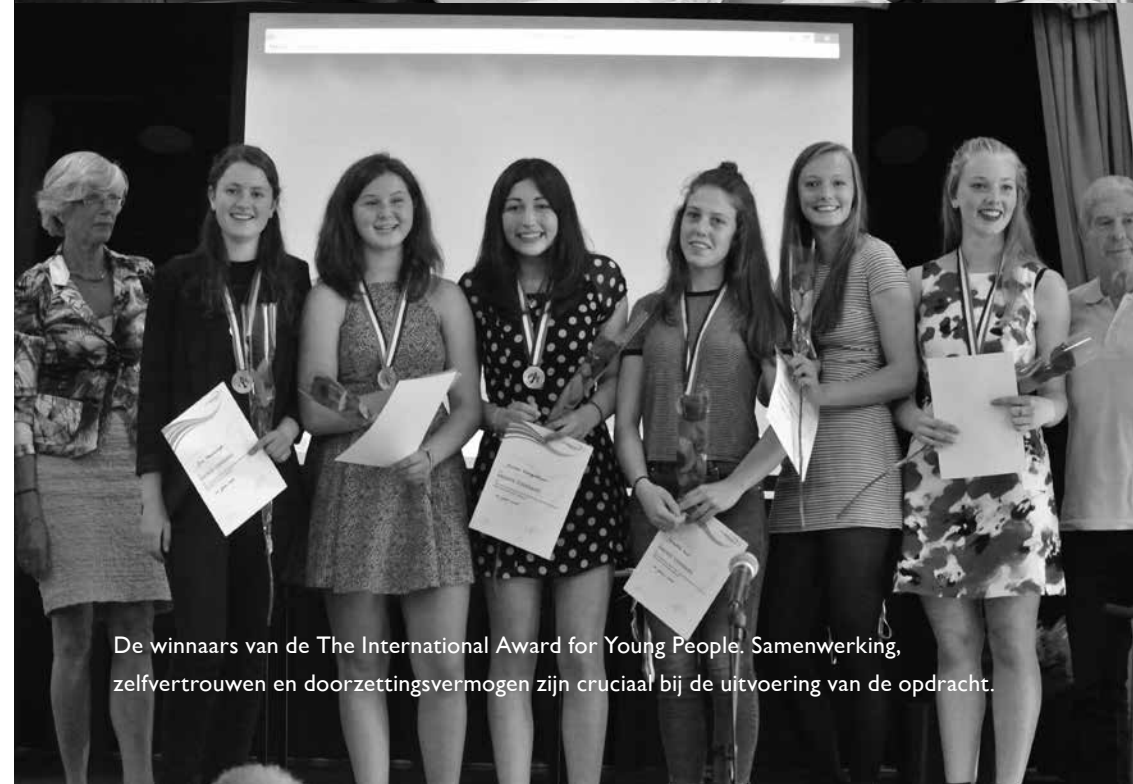
De winnaars van de The International Award for Young People. Samenwerking, zelfvertrouwen en doorzettingsvermogen zijn cruciaal bij de uitvoering van de opdracht.