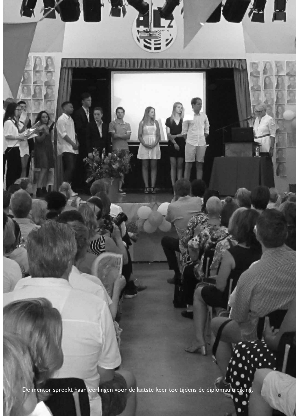
De mentor spreekt haar leerlingen voor de laatste keer toe tijdens de diplomautreiking.