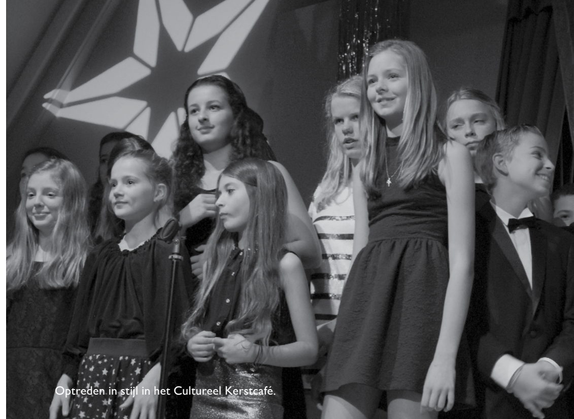
Optreden in stijl in het Cultureel Kerstcafé.

Het gebruik van mobiele communicatie-apparatuur tijdens de sessie van een toets kan worden opgevat als fraude met alle gevolgen als hierboven aangeduid. De rector neemt hierin de beslissing.