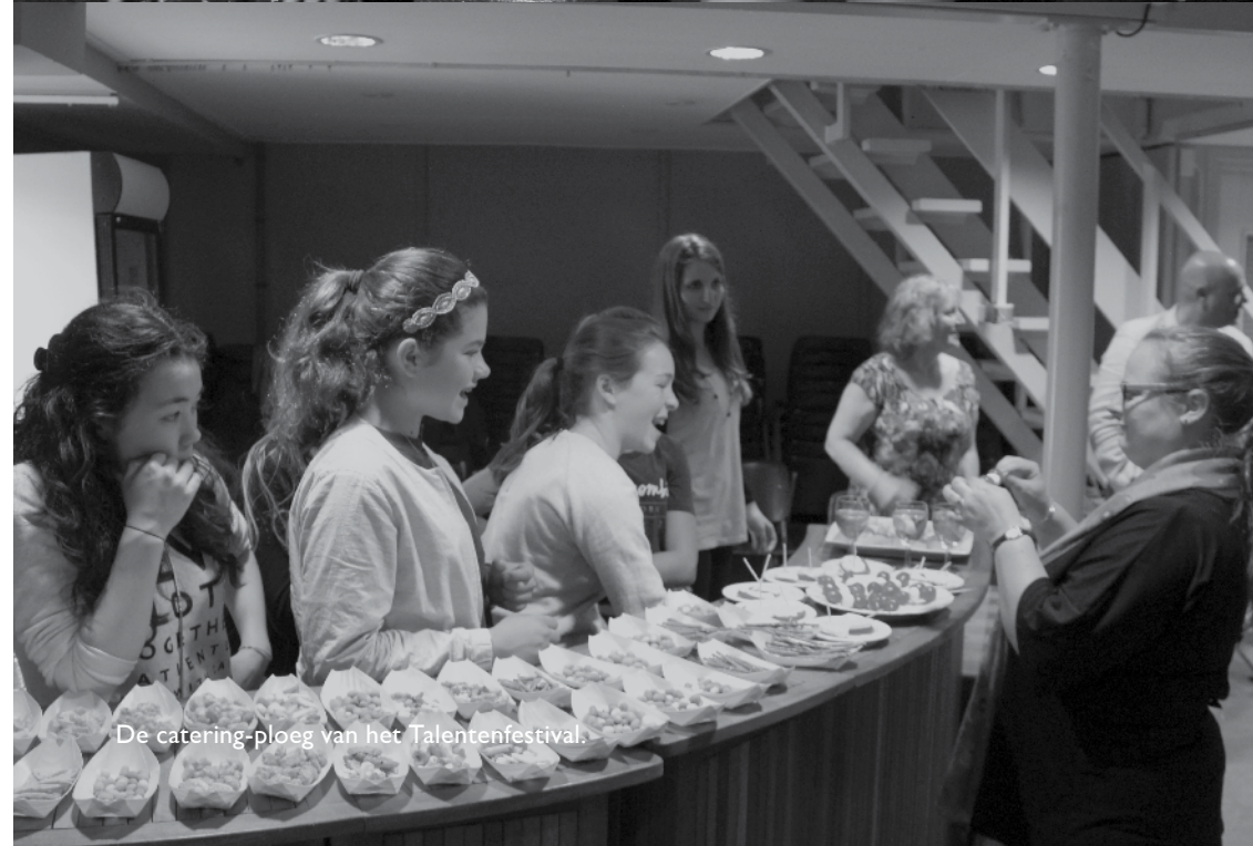
De catering-ploeg van het Talentefestival.