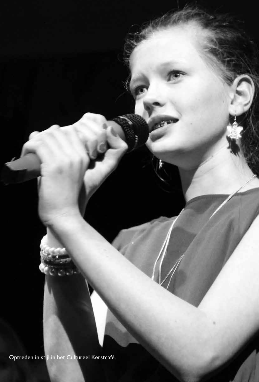
Optreden in stijl in het Cultureel Kerstcafé.

Er zijn meer dan 20 Ouder- en Kindcentra in Amsterdam, dus ook bij u in de buurt. U kunt elke werkdag terecht. U kunt opvoedadvies krijgen via het OKC, telefonisch of via e-mail: www.amsterdam.nl/OKC .