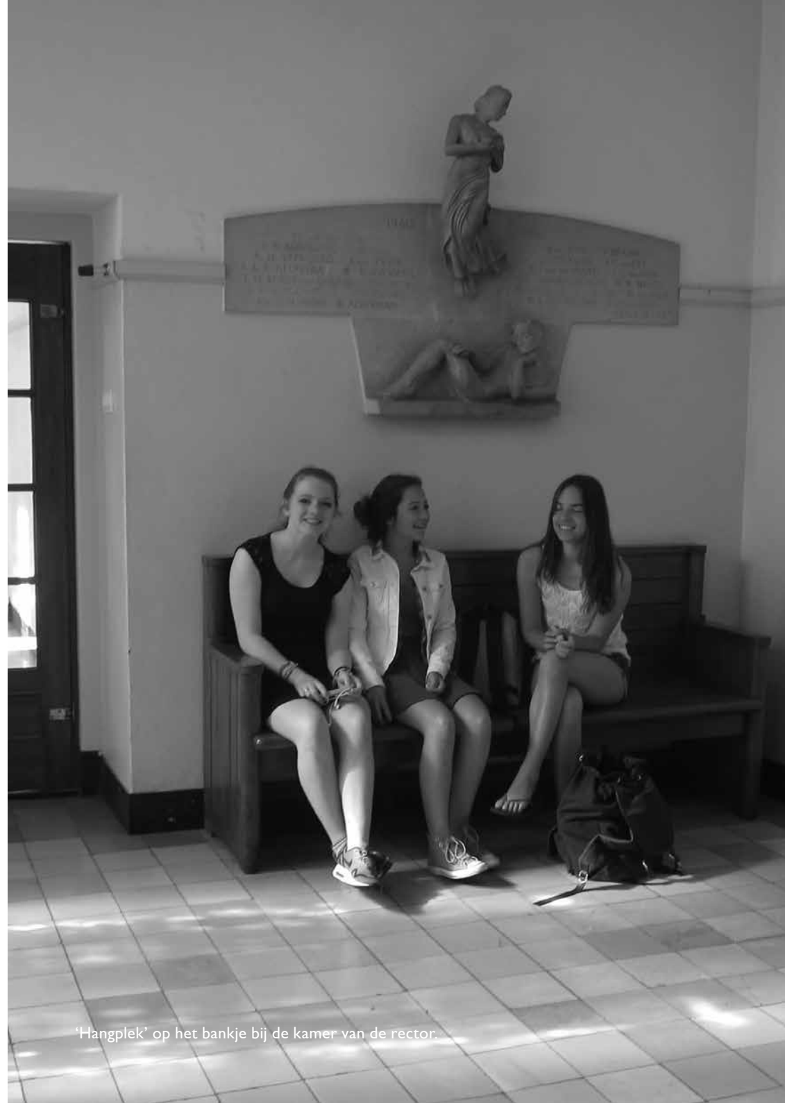
'Hangplek' op het bankje bij de kamer van de rector.

N.B. De directie is te allen tijde bevoegd de kluisjes te openen. De kluisjes worden bij het begin van ieder schooljaar opnieuw toegewezen. Eerste- en tweedeklassers krijgen daarbij voorrang. De school is niet aansprakelijk voor het zoekraken van eigendommen van leerlingen, ook niet als deze in bewaring zijn gegeven aan een medewerker van de school of in een kluisje worden opgeborgen.