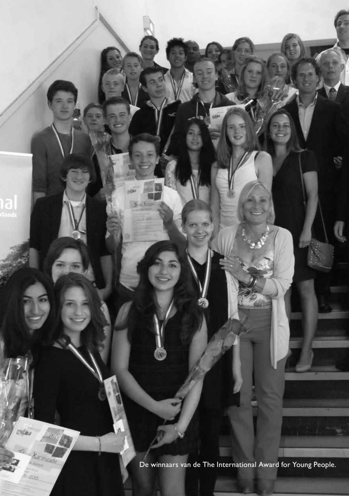
De winnaars van de The International Award for Young People.