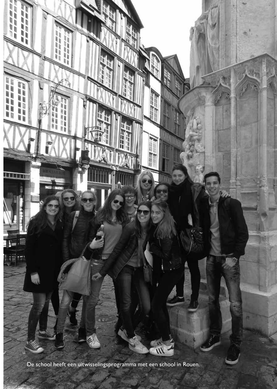
De school heeft een uitwisselingsprogramma met een school in Rouen.

Helycon – onze schoolkrant – is het product van een wekenlange, soms maandenlange, gezamenlijke inzet. De redactie van het blad wordt gevormd door een groep leerlingen, bijgestaan door twee docenten. Zowel de lagere als de hogere klassen laten via vertegenwoordigers hun eigen geluid horen.