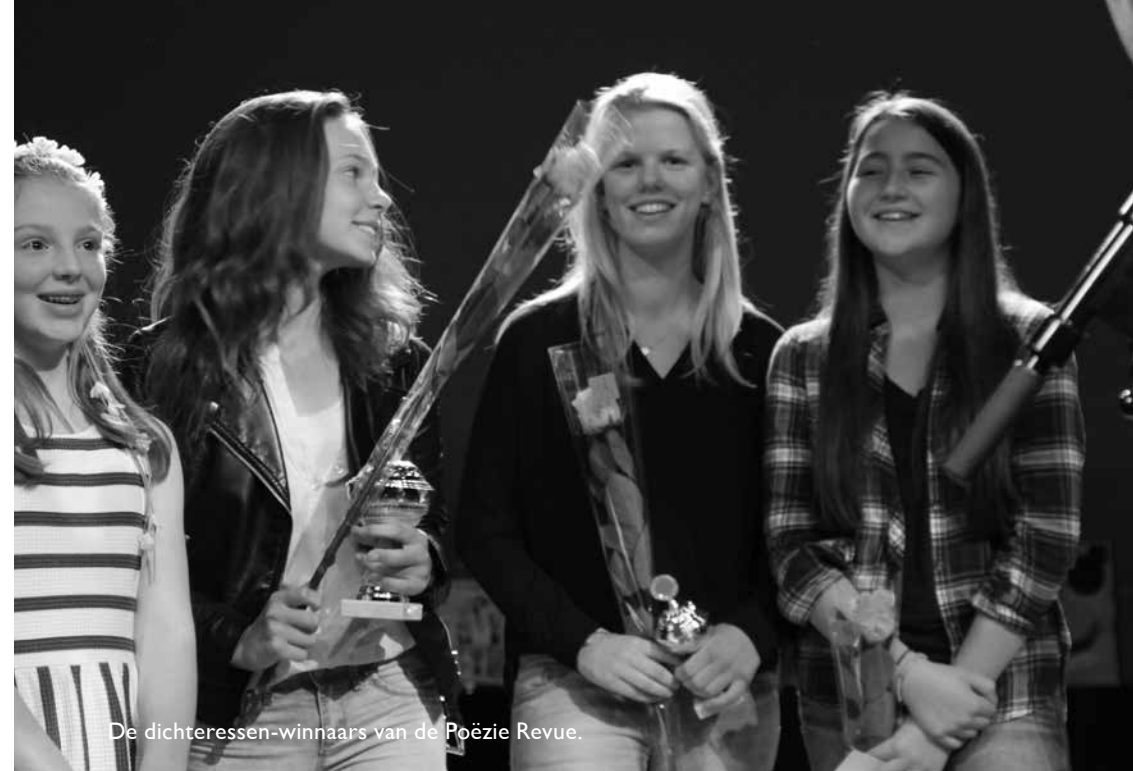
De dichterswinnaars van de Poëzie Revue.