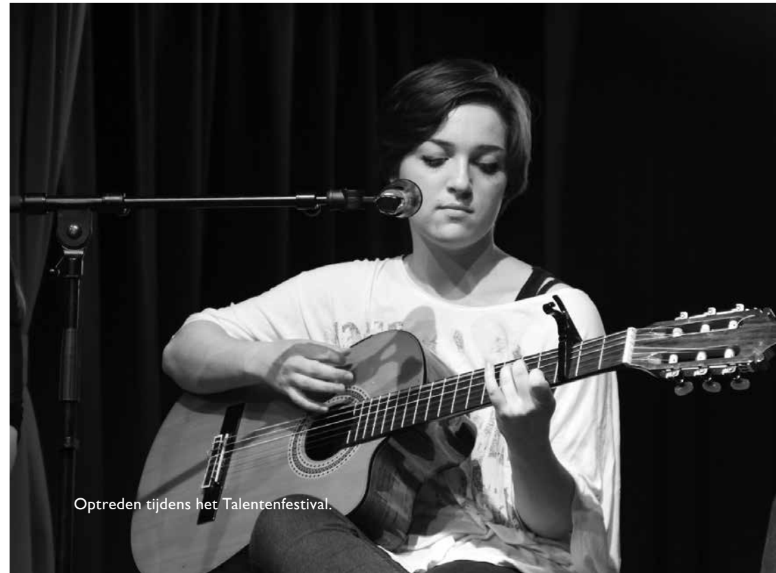
Optreden tijdens het Talentenfestival.

De school organiseert een beroepenvoorlichtingsavond, waarbij onze leerlingen van het vierde, vijfde en zesde leerjaar kunnen spreken met een beroepsbeoefenaar van hun keuze.