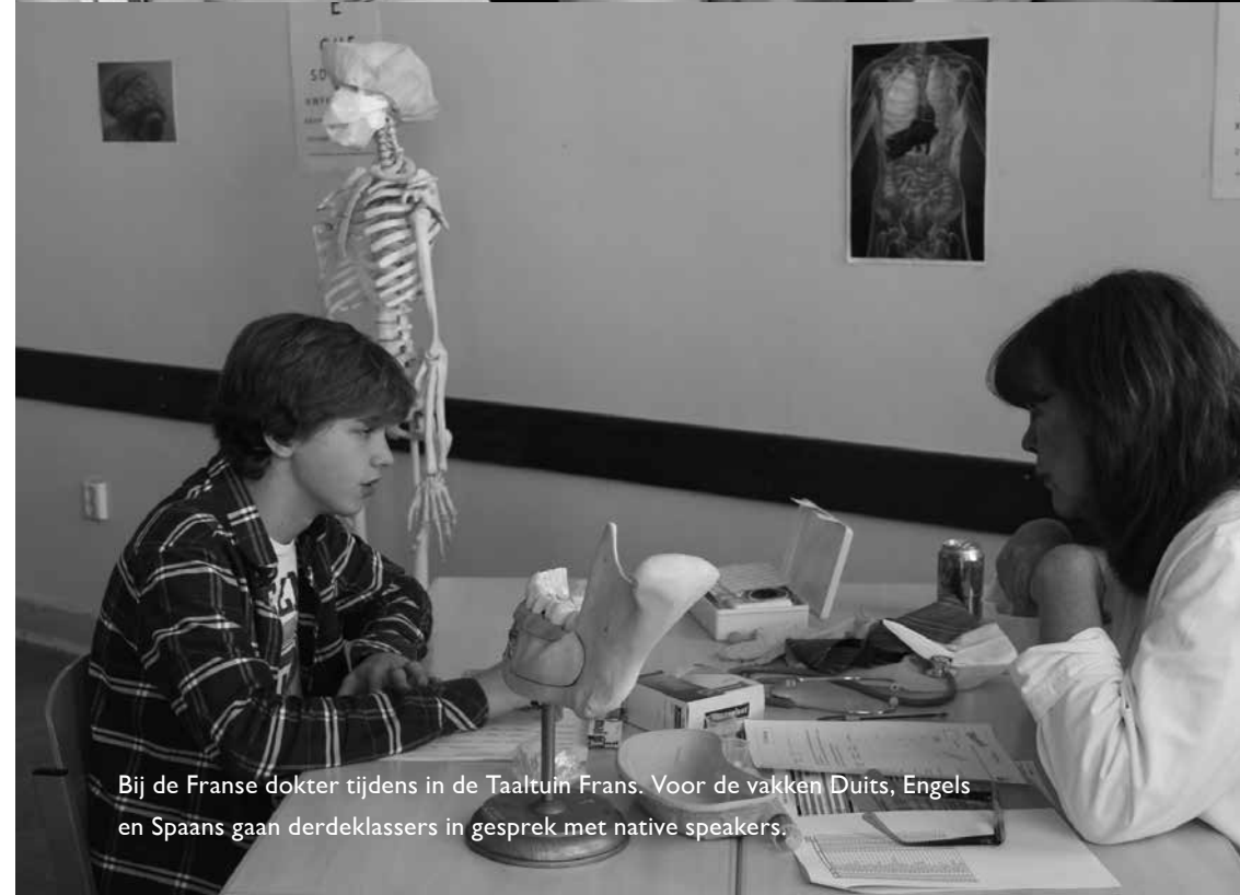
Bij de Franse dokter tijdens in de Taaltuin Frans. Voor de vakken Duits, Engels en Spaans gaan derdeklassers in gesprek met native speakers.