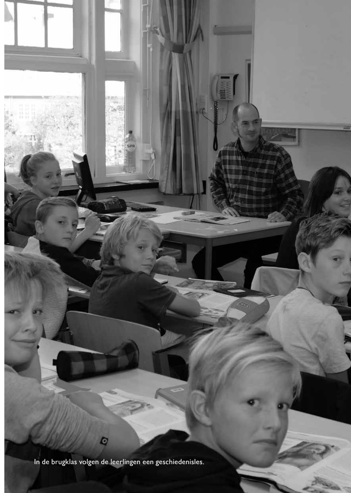
In de brugklas volgen de leerlingen een geschiedenisles.

De betrokkenheid van ouders vinden wij heel belangrijk. Zij kunnen de motivatie in belangrijke mate stimuleren en leerresultaten bevorderen. Dit zal de prestaties en het onderwijs ten goede komen. Zo werken wij met elkaar aan goed onderwijs. Dat is wat wij willen en bieden in ons sfeervolle schoolgebouw onder de groene bomen, waar velen graag nog eens terugkeren.