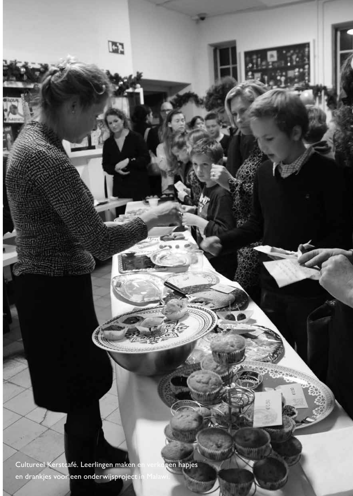
Cultureel Kerstcafé. Leerlingen maken en verkopen hapjes en drankjes voor een onderwijsproject in Malawi.

Binnen de Tweede Fase kan een leerling zijn benoeming binnen de MR beschouwen als verrichte studielast en deze toevoegen aan zijn Sociaal Portfolio.