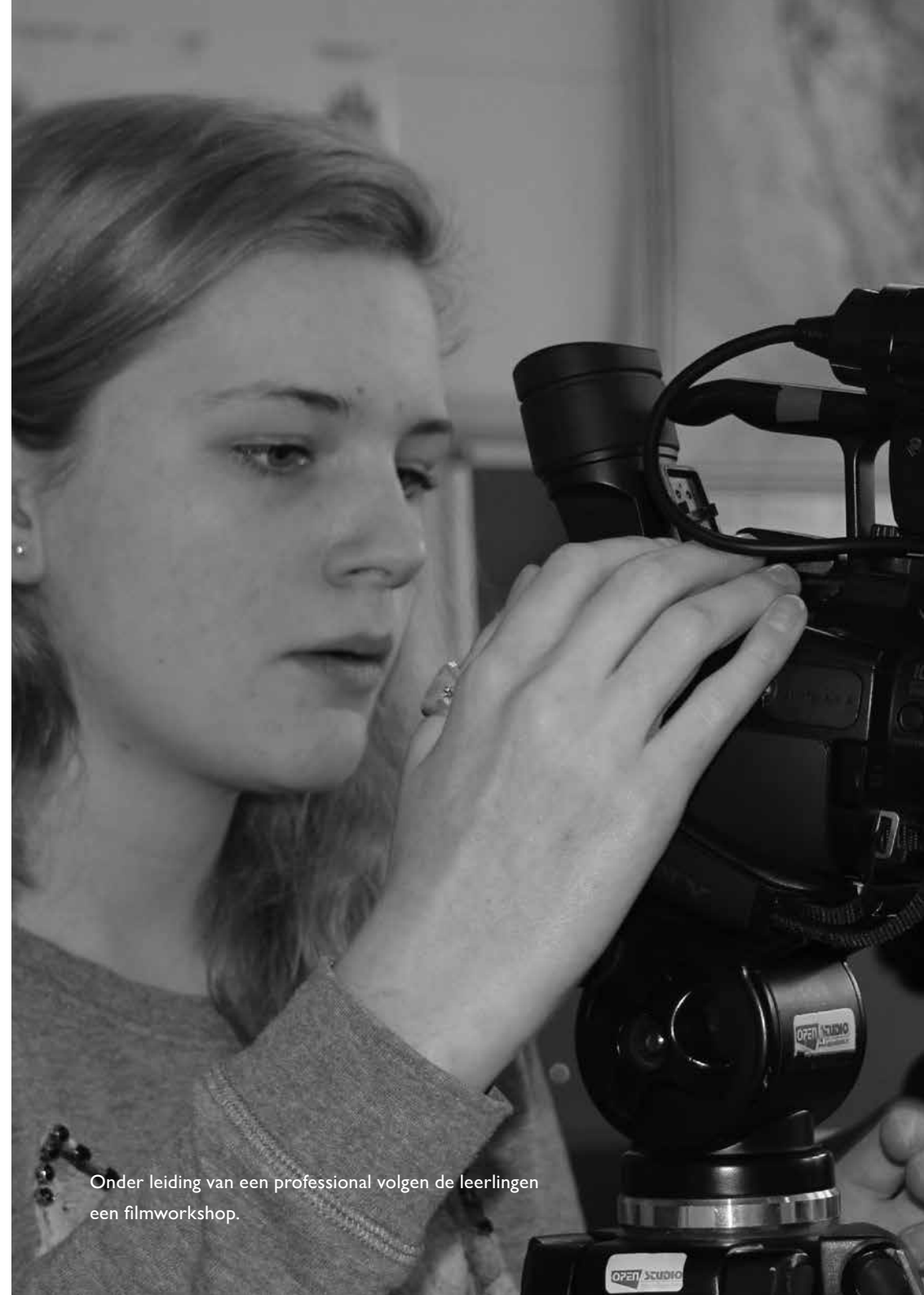
Onder leiding van een professional volgen de leerlingen een filmworkshop.

De resultaten van alle toetsen, praktische opdrachten e.d. bepalen het eindcijfer. De zgn. handelingsdelen moeten altijd zijn afgerond met de beoordeling 'naar behoren'. Voor de afhandeling: zie verder onder Taken.