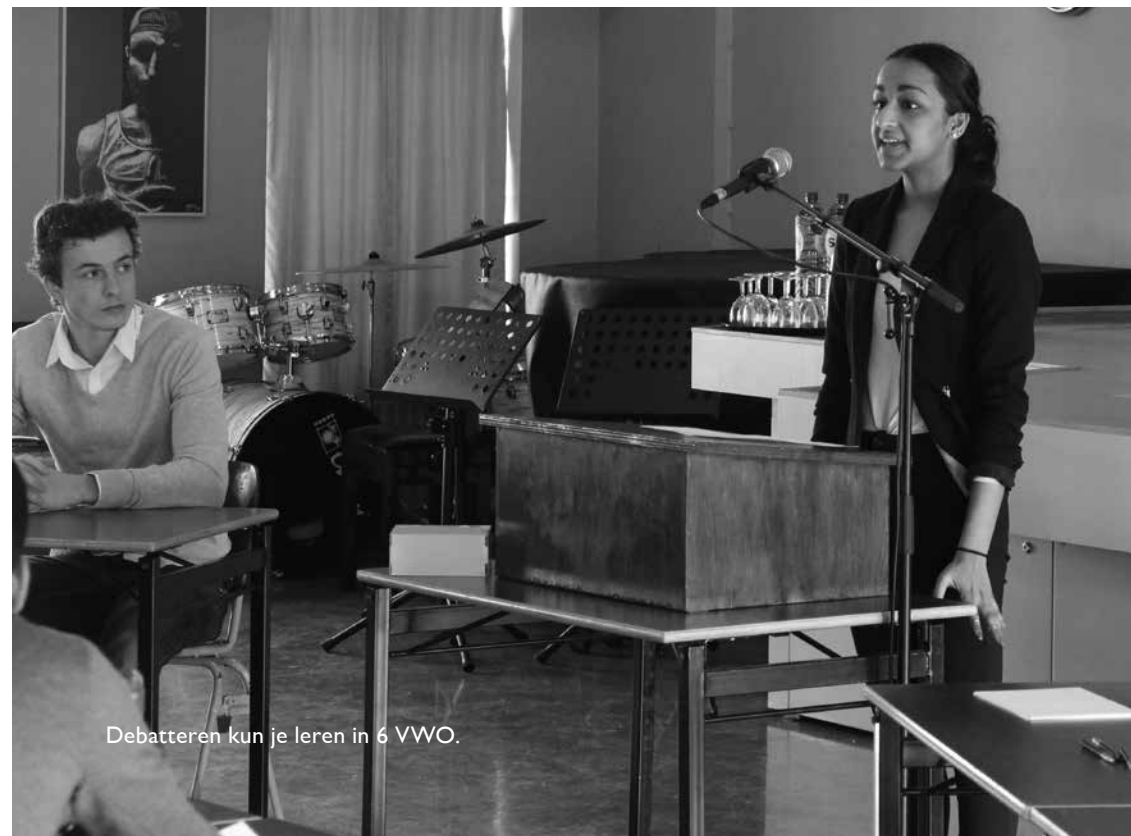
Debatteren kun je leren in 6 VWO.

Overigens, ook als een vak niet betrokken wordt bij de uitslag, wordt dat vak wel vermeld op de cijferlijst. Tenzij de leerling daar bedenkingen tegen heeft geuit (artikel 52 lid 3 van het eindexamenbesluit).