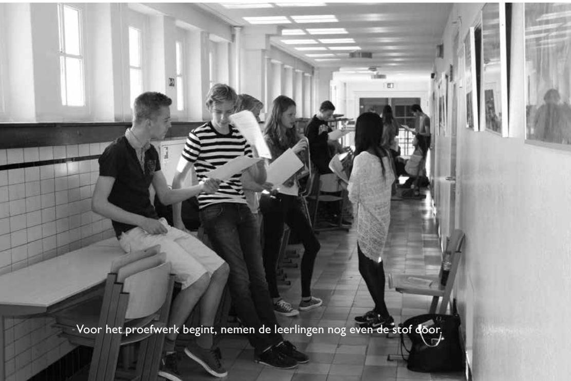
Voor het proefwerk begint, nemen de leerlingen nog even de stof door.

De centrale ouderraad komt vijf maal per jaar bijeen met de directie. De ouderraad organiseert ieder jaar een thema-avond, waarbij doorgaans een opvoedkundig onderwerp centraal staat.