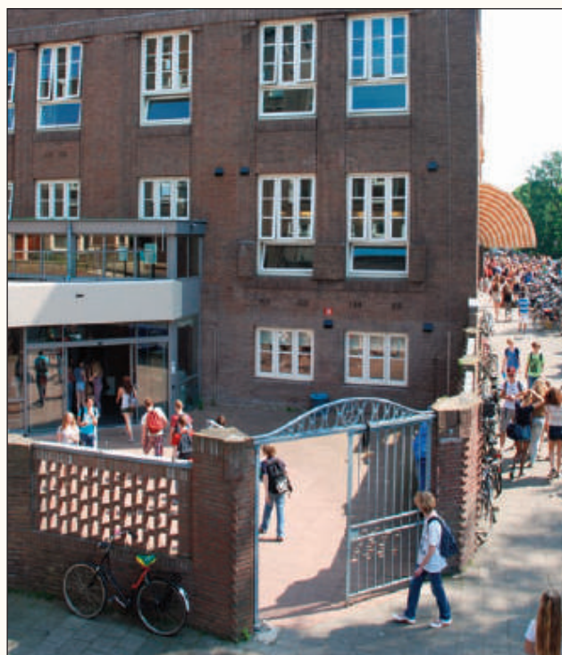
Ingang Gunningplein (westingang, zuidzijde).