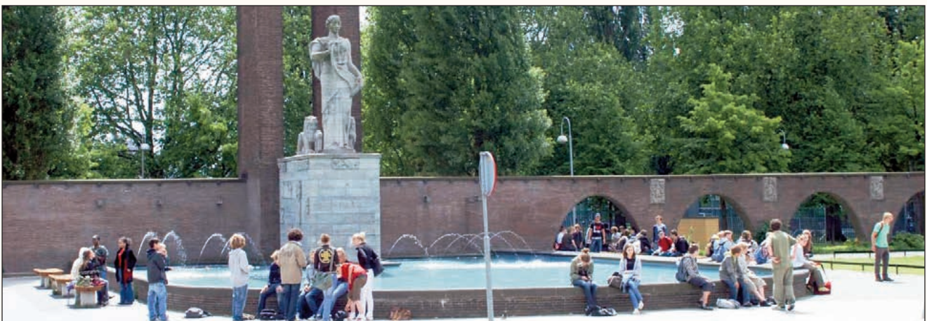
Het Indië-Nederland Monument tijdens de pauze.

Voor de maandag na de herfstvakantie, de kerstvakantie, de voorjaarsvakantie en de meivakantie wordt geen huiswerk opgegeven. Proefwerken worden door de docenten ten minste één week van te voren opgegeven. Ook de stof voor het proefwerk moet dan vaststaan.