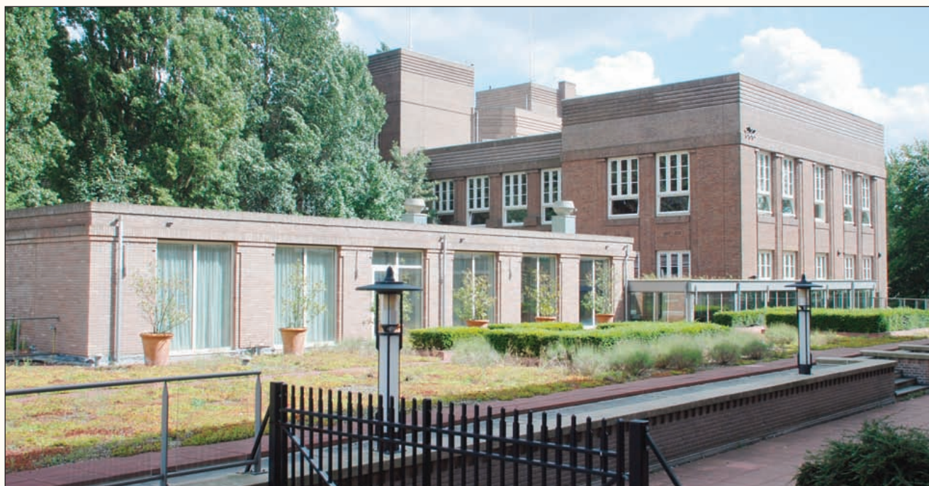
De daktuin voor de docentenkamer boven op de gymzalen.