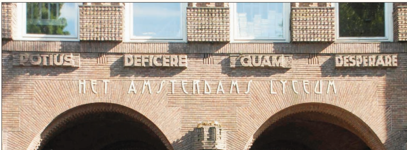
potius deficere quam desperare (noordzijde).