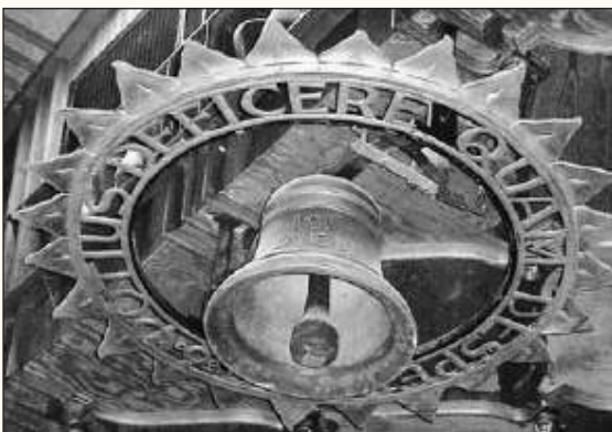
De klok voor de inauguratie van nieuwe leerlingen.

De verwachtingen die we van onze leerlingen hebben, zetten we om in duidelijke eisen aan hun leerprestaties en we gebruiken de evaluatie van die leerprestaties steeds als basis voor begeleiding en hulp bij het leerproces.