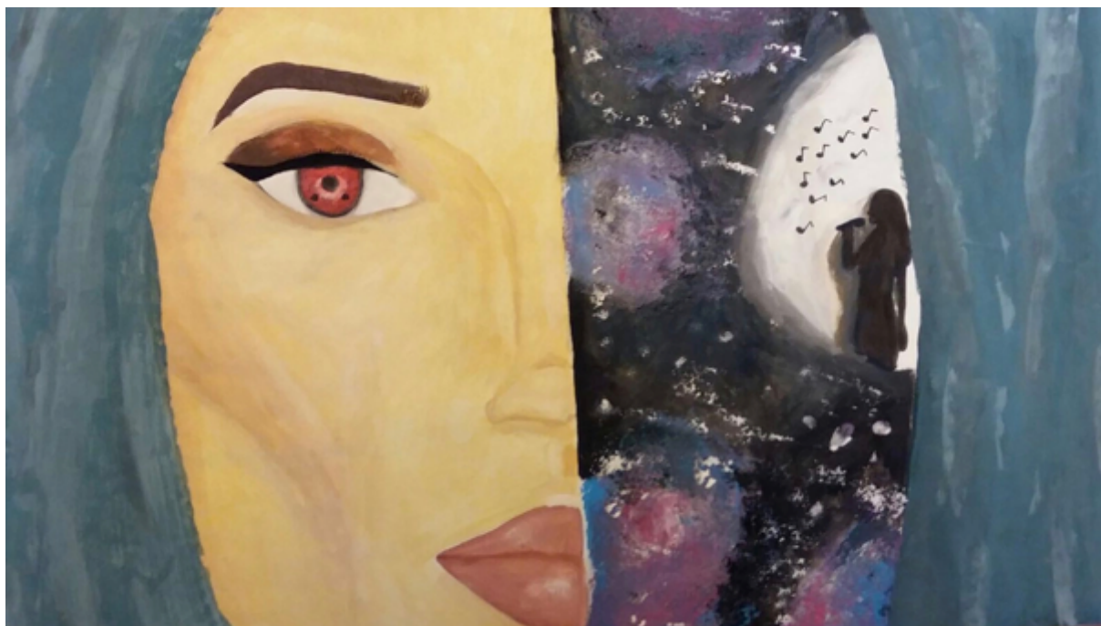
Eindexamenprodukt kunstvakken 2016-2017

Kenmerkend voor deze vakken is dat de leerling vooral zelfstandig kennis opdoet en vaardigheden ontwikkelt. De docent biedt dat niet aan in hapklare brokken maar helpt ze bij het vinden van de kennis en het leren van de vaardigheden. Dit is een werkwijze die ook in het MBO gebruikt wordt. Leerlingen werken door deze werkwijze gemotiveerder én komen hierdoor beter voorbereid aan bij hun vervolgopleiding.